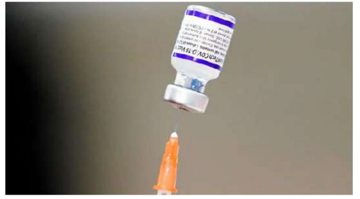
“如果美CDC和FDA應該從新冠疫情中吸取到一個教訓，那就是誠實、清晰、準確、及時地向美國人民提供關於新冠病毒干預措施（包括疫苗接種）的潛在風險和益處的重要性。”

她稱，美CDC和FDA將在她的委員會面前對此作證，並表示“這些機構必須以公開透明的方式迅速調查疫苗是否導致了所報告的中風。”