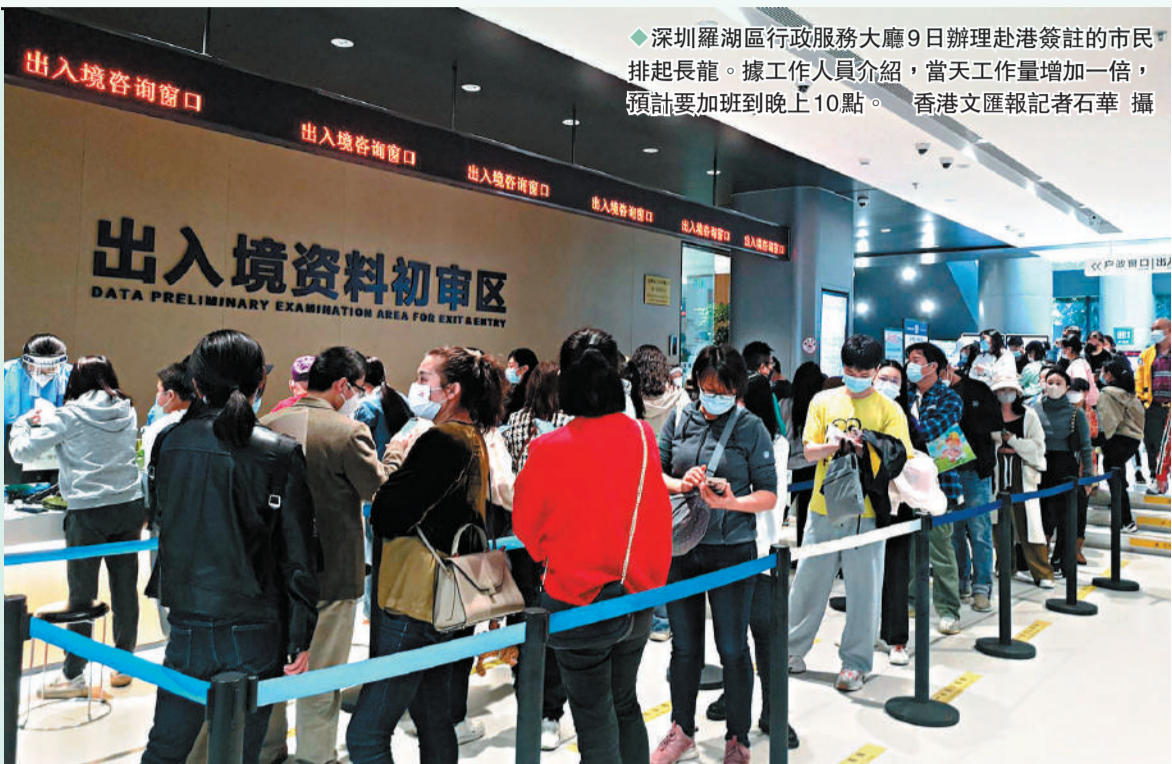
◆深圳羅湖區行政服務大廳9日辦理赴港簽證的市民排起長龍。據工作人員介紹，當天工作量增加一倍，預計要加班到晚上10點。

◆香港文匯報記者 敖敏輝、石華、方俊明、朱燁、孔雯瓊 廣州、深圳、珠海、北京、上海連線報導