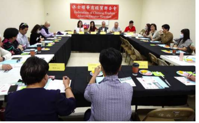
圖為「休士頓華商經貿聯合會」在僑教中心舉行2023年會現場。