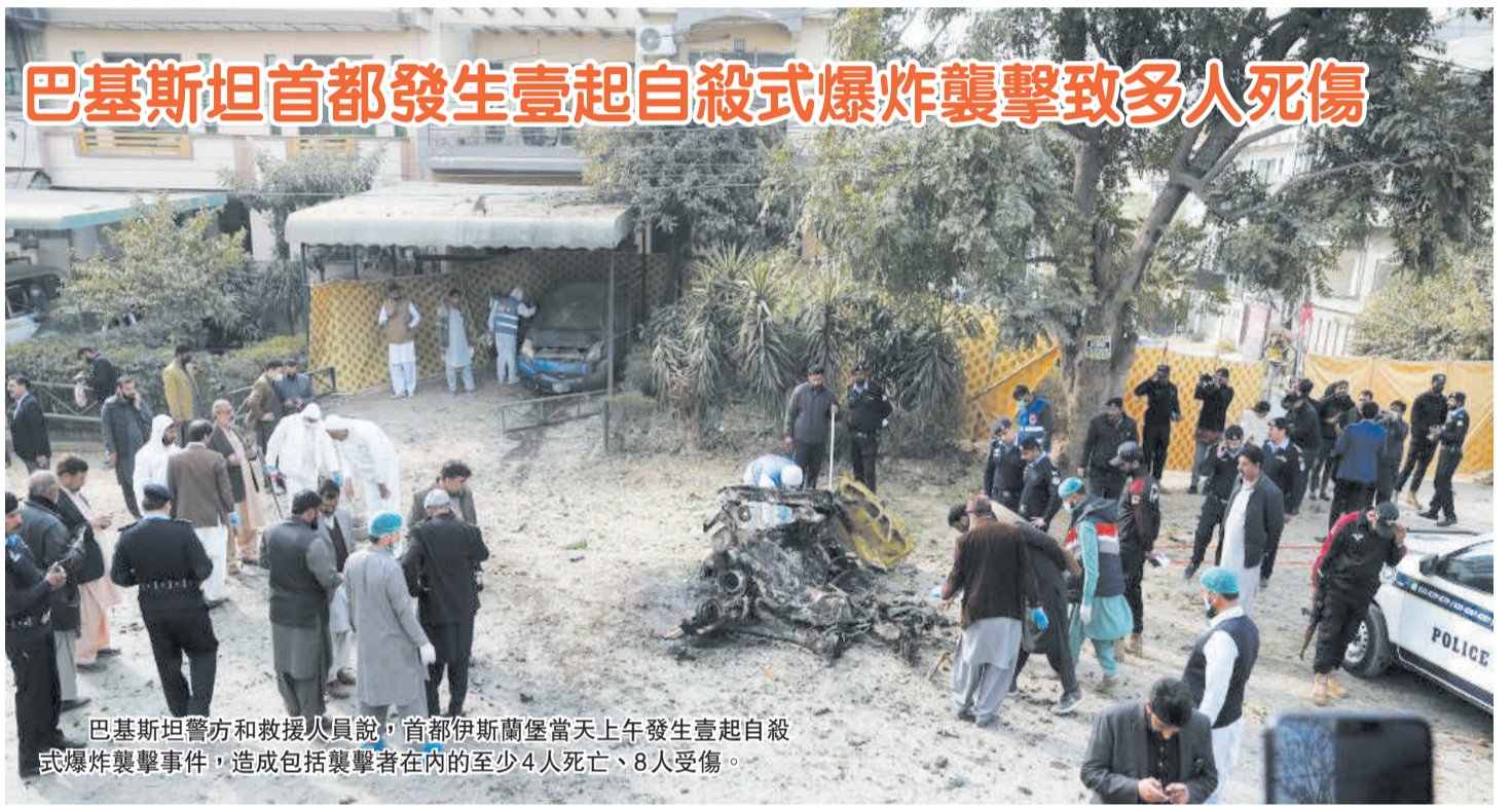
巴基斯坦警方和救援人員說，首都伊斯蘭堡當天上午發生壹起自殺式爆炸襲擊事件，造成包括襲擊者在內的至少4人死亡、8人受傷。