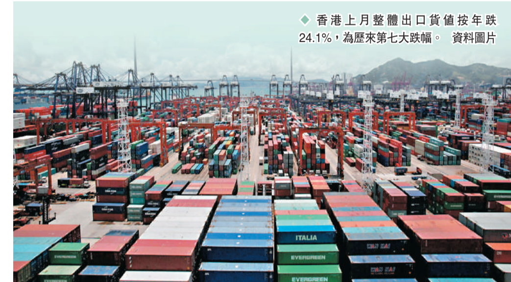
◆香港上月整體出口貨值按年跌24.1%，為歷來第七大跌幅。

若按年比較，輸往亞洲的整體出口貨值下跌25.9%。此地區內，輸往部分主要目的地的整體出口貨值錄得跌幅，尤其是日本跌30.4%、中國內地跌29.7%、菲律賓跌22.7%、越南跌22.2%和台灣