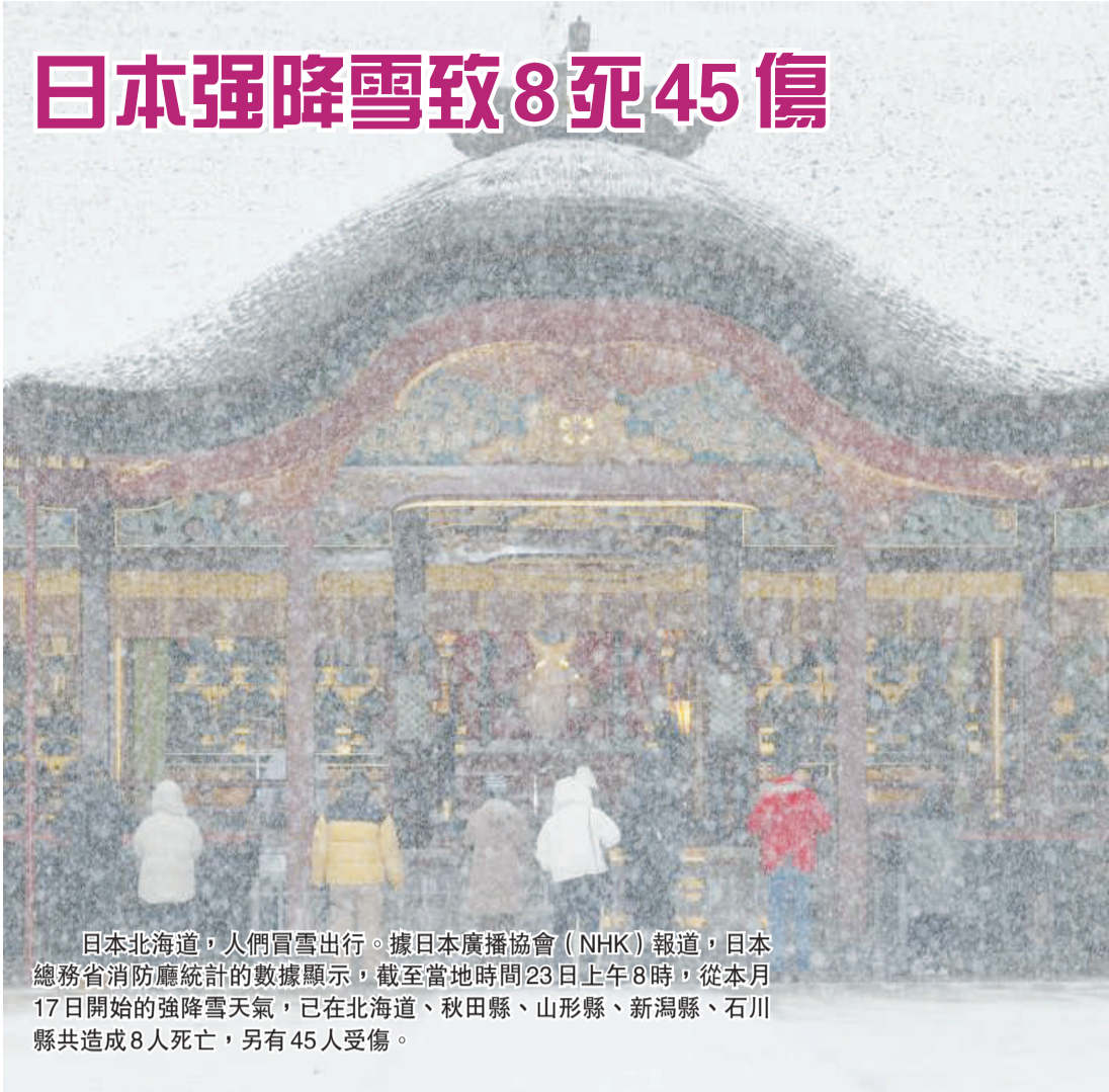
日本北海道，人們冒雪出行。據日本廣播協會（NHK）報道，日本總務省消防廳統計的數據顯示，截至當地時間23日上午8時，從本月17日開始的強降雪天氣，已在北海道、秋田縣、山形縣、新潟縣、石川縣共造成8人死亡，另有45人受傷。