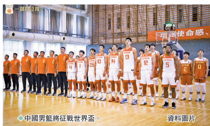
◆中國男籃將征戰世界盃。