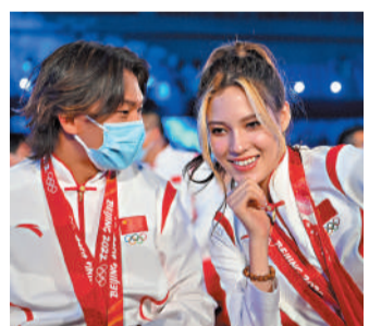
◆谷愛凌(右)與蘇翊鳴將出席極限運動會。資料圖片