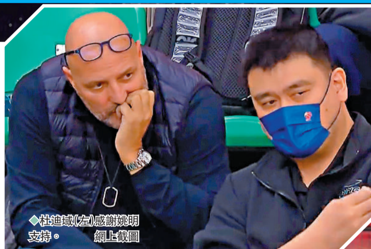
◆杜迪域(左)感謝姚明網上截圖