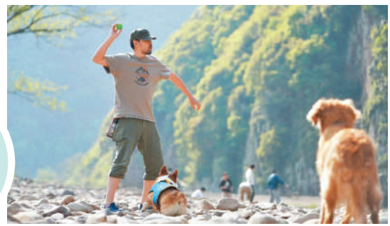
◆主人與寵物在玩耍。