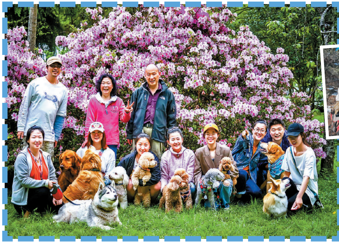
◀ 內地養寵人群急速增加，催生出寵物出行、寵物醫療、寵物食品等寵物細分行業。圖為浪小爪組織的寵物旅行活動。