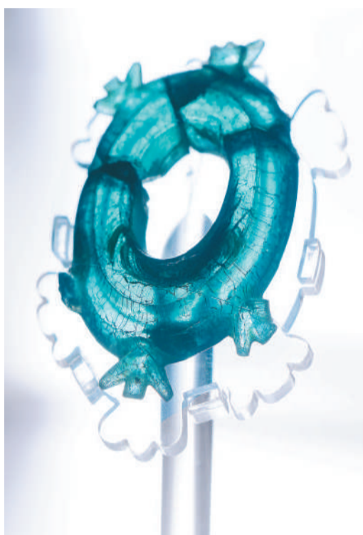
▲ 汉代角轮形玻璃环

了一组专题陈列:展现宋元明清时期釉彩瓷器之美的“釉彩斑斓——馆藏瓷器陈列”,展现中国古代工艺美术悠久历史和精湛技艺的“匠心器韵——馆藏工艺珍品陈列”,展现海上丝绸之路繁荣景象的“合浦启航——广西汉代海上丝绸之路”专题陈列。其中,“合浦启航”展厅人气最高,在这里可以看到广西汉墓中出土的各种与海上贸易相关的珍贵文物,大部分为首次展出。