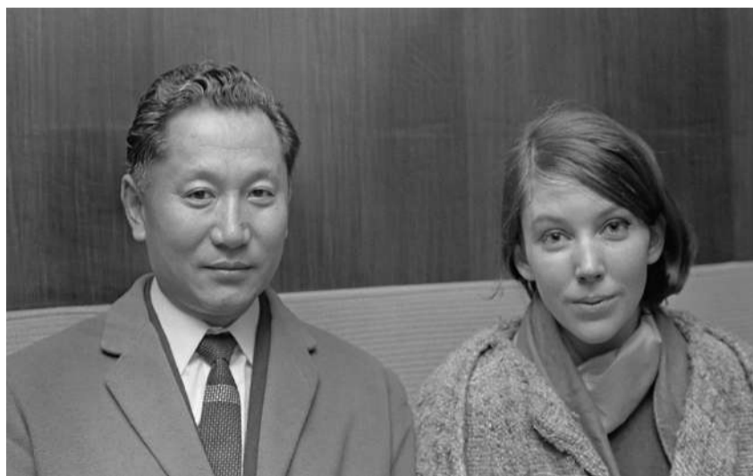
末代国王巴登顿珠南嘉1963年与美国人霍普·库克举办婚礼，轰动全球