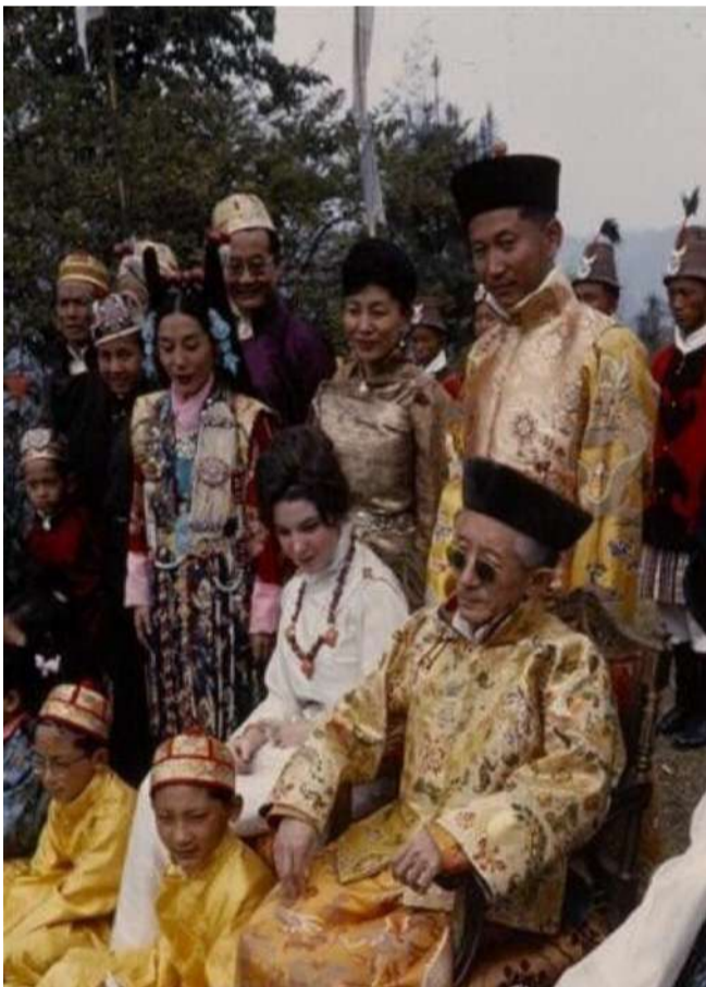
锡金第11任国王塔西南嘉（前排左一）与王储、王储妃、公主们

中国拒绝承认印度对锡金的主权，在中国的中学课本上，锡金也作为主权国家标注于世界地图，直到2003年。当年印度总理访华，两国达成一致：中国承认锡金属于印度，印度承认西藏属于中国。自2005年起，中国中学课本的世界地图上不再有锡金。锡金王室随风而去，成为喜马拉雅山脚下的绝美回忆。