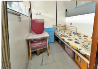
◆院舍負責人聲稱板間房尺寸符合政府規定最小要求。