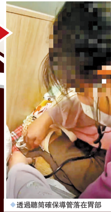
◆透過聽筒確保導管落在胃部