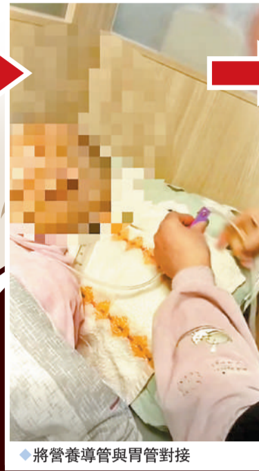
◆將營養導管與胃管對接