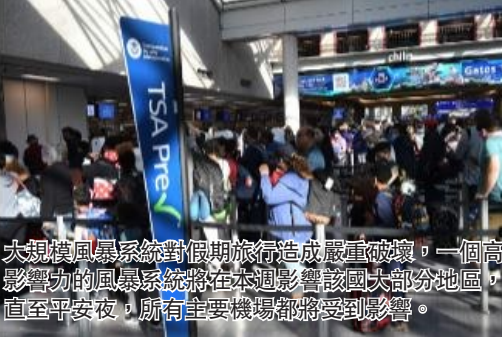
大規模風暴系統對假期旅行造成嚴重破壞，一個高影響力的風暴系統將在本週影響該國大部分地區，直至平安夜，所有主要機場都將受到影響。

大規模風暴系統對假期旅行造成嚴重破壞，一個高影響力的風暴系統將在本週影響該國大部分地區，直至平安夜，所有主要機場都將受到影響。新英格蘭各地的警方對數百起週末車禍或車輛滑出道路做出了回應。緬因州警方