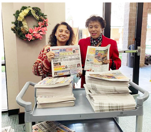
Mona和思杜派發號角月報與美南福音版暨中信月刊。