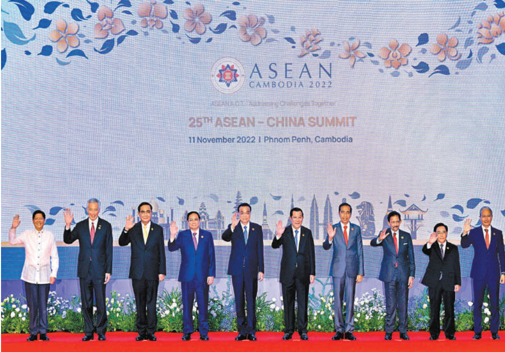
◆東埔寨金邊時間11月11日下午，中國國務院總理李克強在東埔寨金邊出席第25次中國－東盟（10+1）領導人會議。圖為與會領導人集體合影。新華社