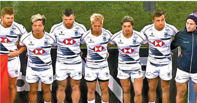
◆香港欖球隊繼泰國站後再度於仁川站捧盃，此刻播放的才是正確的國歌。視頻截圖

選委會委員、大律師吳英鵬接受香港文匯報訪問時表示，如果事件有身處香港者參與夥同犯罪，特區政府應依照香港國安法、《國歌條例》和《刑事罪行條例》有關條文嚴肅追究。對於網上已經流傳的相關視頻，其內容具有一定煽動性，如果有人懷非法之動機，把有關視頻用作非法之用途，亦有可能干犯煽動罪甚至國安法罪行。