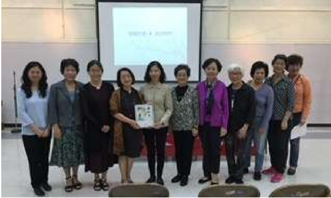
2019年三月錢南秀教授（左二），偕台灣中正大學毛文玉教授講述（明清人文畫像的抒情演繹），會後與美南作協會友合影。

（美南作協／石麗東撰）執教美國休士頓萊斯大學RICE UNIVERSITY廿九載的「中國文學」教授錢南秀於本月十六日逝世，走完她一生勤勉治學、誨人不倦、融貫中西文學研究，竭誠推展國際學術交流的不凡風範。