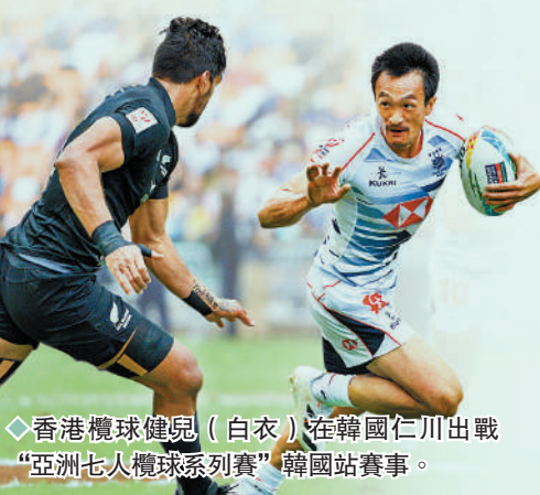
◆香港欖球健兒（白衣）在韓國仁川出戰“亞洲七人欖球系列賽”韓國站賽事。

◆國際大型賽事中牽扯國歌播放的機制設置竟存在如此重大疏漏，實在有違常理。而若事件真屬個人行為，亦說明有關機制脆弱到無法避免被別有用心者利用，若未來再有人企圖借大型賽事行播“獨”或侮辱他國等荒唐事，是否仍如入無人之境，爲所欲爲？主辦方必須拿出有效機制杜絕此類事件重現。