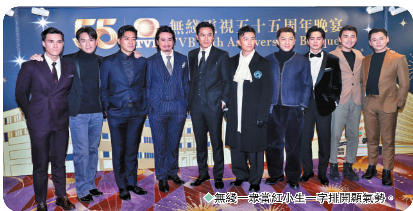
◆無線一眾當紅小生一字排開顯氣勢。

“過去多年，香港經歷不少風雨，TVB的新聞報道中立客觀，不偏不倚呈現事實，與所有市民一起經歷，一起成長。我們從來不忘記企業的社會責任，做好本業的同時，亦與社會同喜同悲。開台以來，透過各類型籌款節目和TVB的職藝員愛心基金等等，我們已為有需要人士籌得超過港幣65億元善款，受惠家庭數以百萬計。展望未來，在不斷的改革和創新的同時，TVB也會抓緊國家和特區政府的發展方向。無論在運營模式以及內容創作上，我們都會不斷地自我更新，勇敢嘗試。我們不能安於現狀，更加不會陶醉在過去的成績，必定時時刻刻緊記不進則退的硬道理。我們會全力擁抱因為科技、大數據和移動互聯網繼續進步而帶來的機遇。我們也會加大人才培訓的投入，為香港的媒體娛樂行業，培育出更多年輕