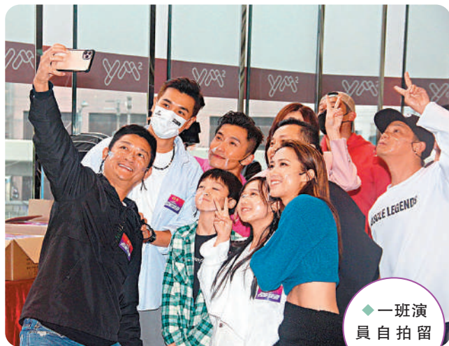
◆一班演員自拍留念。