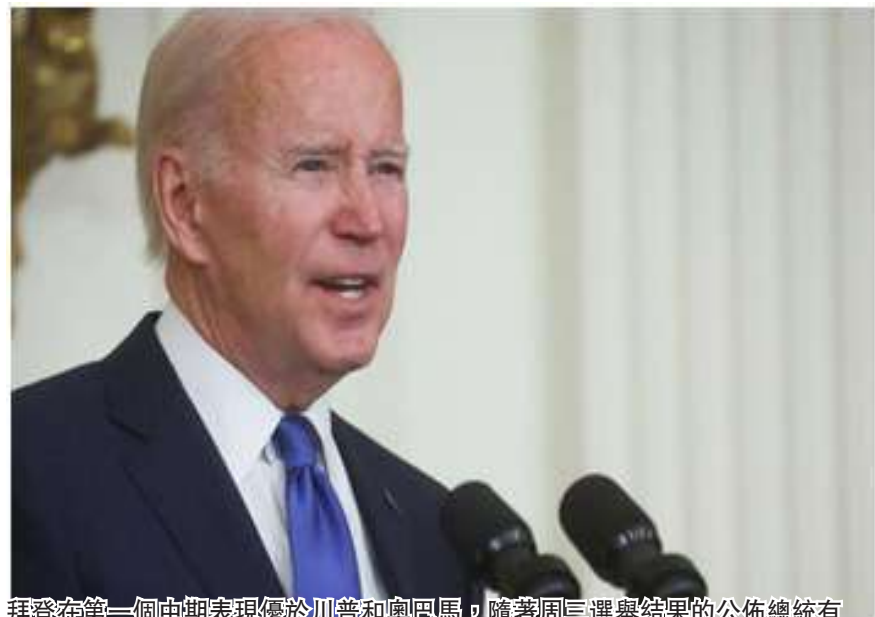
拜登在第一個中期表現優於川普和奧巴馬，隨著周二選舉結果的公佈總統有很多樂趣可言，儘管他的民主黨人可能會險些失去對國會的控制權

（休士頓/秦鴻鈞報導）隨著中期選舉結果的公佈，拜登總統感到高興，儘管他的民主黨可能會失去對國會的控制。共和黨人可能會在眾議院勉強獲得微弱多數，而參議院仍有待爭奪，亞利桑那州、佐治亞州和內華達州的關鍵競賽尚未決定。但這對白宮來說都是好於預期的消息。民主黨人在全國大選中逆轉了可怕的預測，在被認為對2024年下一次選舉至關重要的州贏得了州長競選，並通過了左傾措施，例如在密歇根州制定墮胎權。拜登親自致電三打贏得競選的民主黨人向他們表示祝賀。助手和盟友認為，他在墮胎權、右翼政治極端主義和醫療保健方面為選舉做出的努力阻止了共和黨的浪潮。共和黨人可能會佔領眾議院，這意味著他們可以阻止拜登在全國範圍內將墮胎權合法化或禁止銷售攻擊性武器的承諾，並對他的政府和家庭展開可能具有破壞性的調查。民調顯示，雖然共和黨人將高通脹和犯罪列為首要投票問題，但民主黨人表示，他們更傾向於墮胎權和槍支暴力。