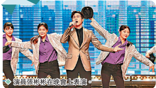
◆演員張彬彬在晚會上表演。

香港文匯報訊（記者 姚進 長沙報道）第十四屆中國金鷹電視藝術節開幕式暨文藝晚會4日晚在湖南長沙舉行，首次開關兩大會場。