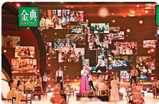
◆晚會為觀眾呈現一場電視藝術盛宴。

據悉，本屆金鷹節還將舉辦“藝術家走基層”“金鷹論壇”“頒獎晚會”等五項主體活動，並將揭曉備受關注的第31屆中國電視金鷹獎各獎項。