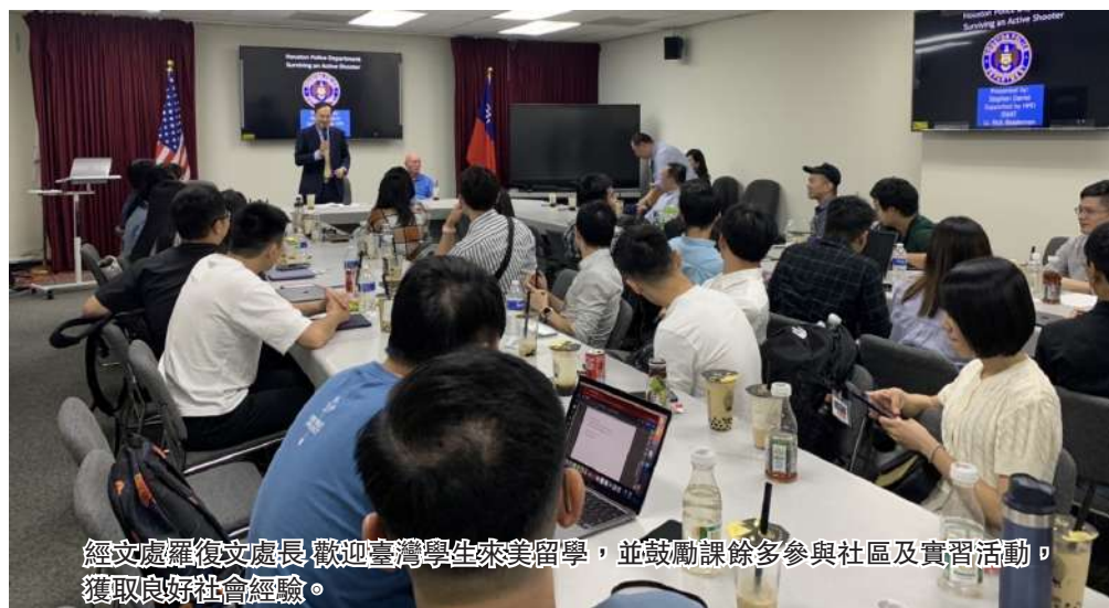
經文處羅復文處長歡迎臺灣學生來美留學，並鼓勵課餘多參與社區及實習活動，獲取良好社會經驗。