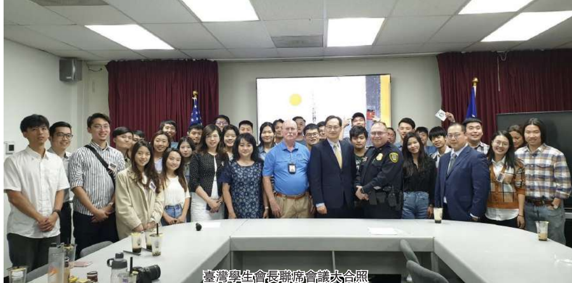
臺灣學生會長聯席會議大合照

【本報訊】為聯繫及妥為輔導服務區臺灣留學生社團，駐休士頓辦事處於本(9)月30日(週五)辦理因疫情之故睽違兩年的美南(中)臺灣同學會會長聯席會議，邀請奧克拉荷馬、阿肯色、路易斯安納、密西西比、密蘇里、堪薩斯、科羅拉多及德州等8州學生會會長及幹部參與，另邀請大休士頓地區臺裔主流學校教師及教授，共同出席慶祝教師節校園安全專題講座，全程逾50人出席，其中40人實體參加，其餘透過雲端平台加入，活動歷時5小時，互動溫馨熱烈。