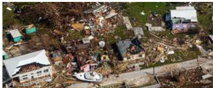
颶風伊恩在佛羅里達州西南部造成了嚴重破壞，居民被困在被洪水淹沒的房屋中，至少損壞了一家醫院，並導致超過200萬人斷電，然後在美國東部時間週四凌晨5點降級為熱帶風暴

(休士頓/秦鴻鈞報導)週四前往佛羅里達州西南部一睹颶風伊恩造成的破壞後，州長德桑蒂斯將李縣薩尼貝爾島的影響描述為嚴重破壞，沒有撤離的人被從空中救出。通往大陸的堤道被撞倒。佛羅里達當局確認有12人死於風暴，隨著工作人員進入社區，死亡人數可能會大幅增加。總統拜登週四表示，這可能是佛羅里達州歷史上最致命的颶風。夏洛特縣官員證實有六人死亡，而李縣官員證實有五人死亡。此外，在佛羅里達州中部，一名72歲的 Deltona 男子在排乾游泳池時從斜坡上摔下來後死亡。李縣警長卡邁恩馬塞諾在早安美國的早晨露面時說，死亡人數數百人。馬塞諾後來說，在當局趕到現場之前，他無法“給出真實的評估”。