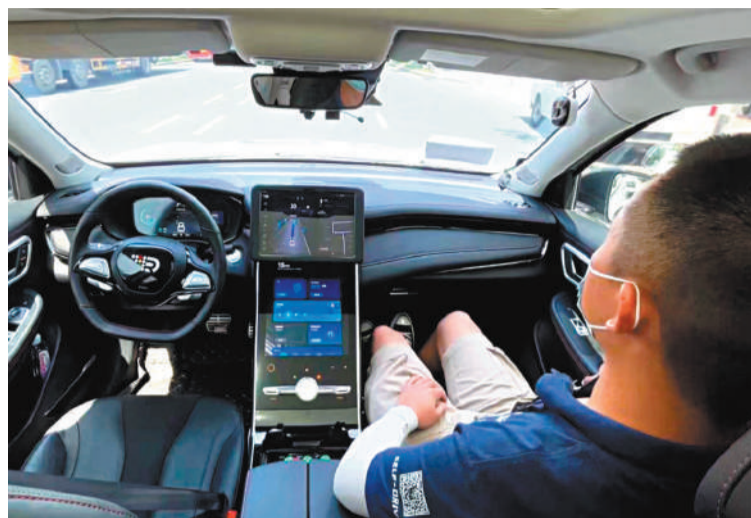
8月1日，中國首部智能網聯汽車管理法規《深圳經濟特區智能網聯汽車管理條例》正式實施。圖為元戎啟行的全無人駕駛汽車上路測試。