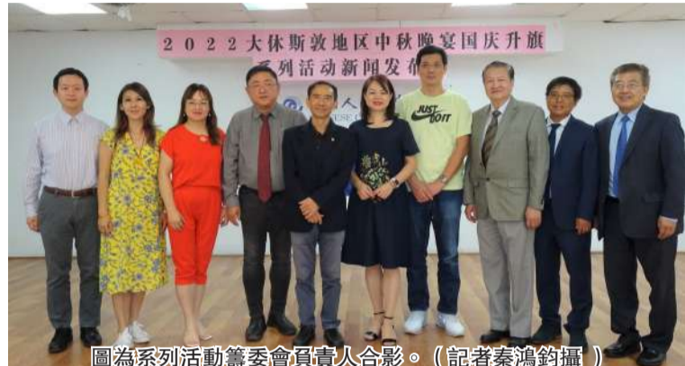
圖為系列活動籌委會負責人合影。