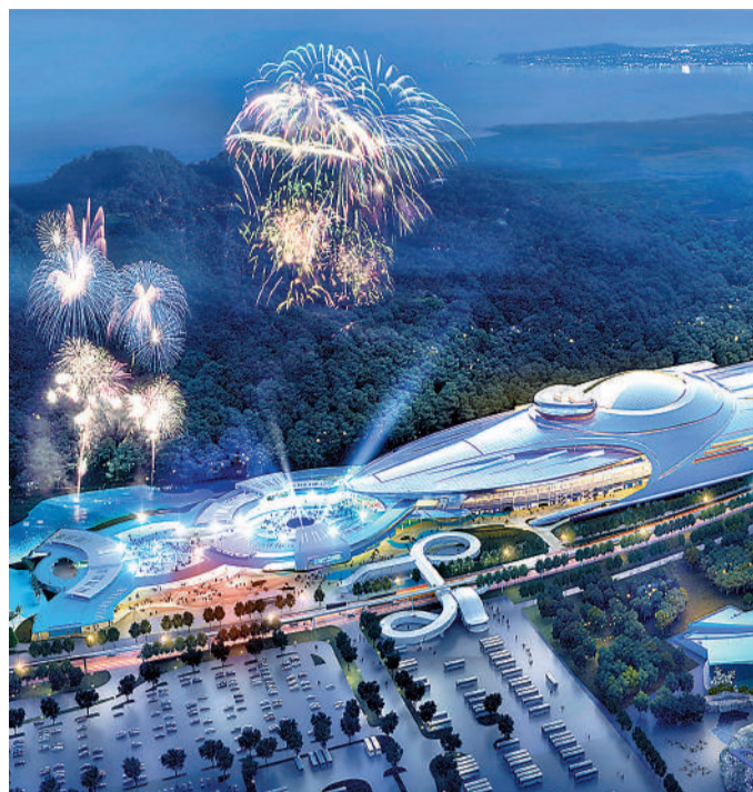
長隆海洋科學樂園設計圖。