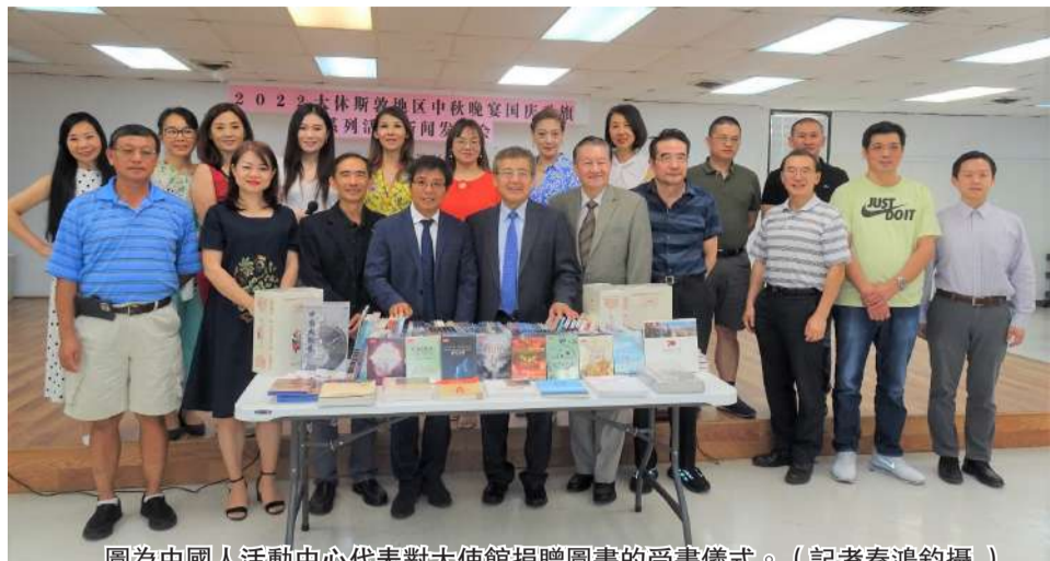
圖為中國人活動中心代表對大使館捐贈圖書的受書儀式。