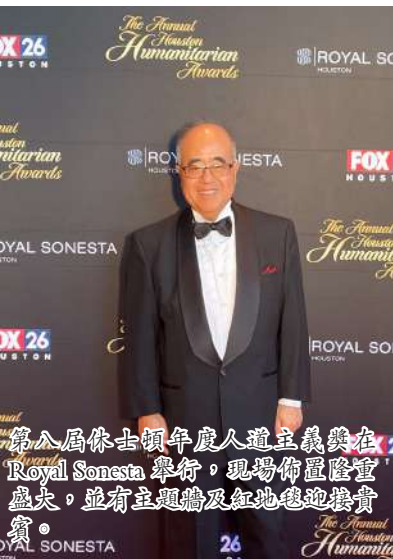
第八屆休士頓年度人道主義獎在Royal Sonesta舉行，現場佈置隆重盛大，並有主題牆及紅地毯迎接貴賓。