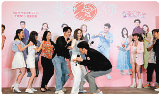
◆ 一眾藝人參加遊戲比賽，顯出童真。