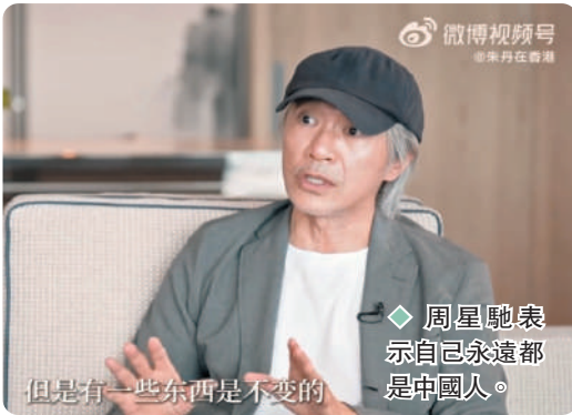
◆ 周星馳表示自己是中國人。

星爺憶述以前曾有內地導演告訴他，被他的電影啟發，他指自己的創意也有受到內地電影啟發，所以香港和內地電影人的關係一直是互相支持、互相學習的。他還表示：“香港的年輕電影人應該利用粵港澳大灣區的優勢，把中國的故事發揚光大，既可以享受到龐大市場，也可以帶動大灣區的發展。我希望香港的未來，在國家的支持底下，可以繼續保持創新活力，我們一起努力去創造未來。”