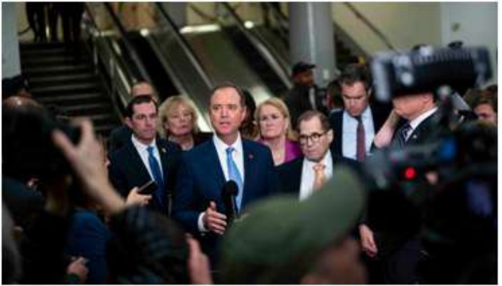
在過去的幾天里，各大電視台一直在播放關於2021年1月6日發生的國會大廈暴動問題的聽證會，根據最近的民意調查，大多數人，52%的人，已經表示為1月6日的國會大廈暴動應該起訴川普

川普有可能會坐牢。這位前總統如今已是普通公民，而被調查的活動多數發生在他就任總統之前，這意味著他的前總統身份並不能成為保護他的法律屏障。美國歷史上還沒有任何一位前總統面臨過刑事指控，而川普的支持者已經認為這個起訴是出於政治動機。川普一直高調地宣稱，紐約的這個調查是非法的。在傳出組建大陪審團的消息後，川普6月28日夜間發表博文，再次發出抱怨。川普說：紐約市和紐約州正在蒙受他們歷史上最高的犯罪率，他們不去捉拿謀殺犯、販毒分子、人口販子和其他人，卻來打擊川普。前檢察官佩里說，絕對毫無疑問的是，川普會盡可能長的延續這樣的辯護策略。在很多方面，對一位刑事被告來說，拖延就是勝利。但是，如果川普被定罪，共和黨將感到尷尬；也必將對未來民主與共和兩黨的重大選舉戰產生強烈影響。精明的民主黨絕對不會放過起訴川普的這個千載難逢的機會。