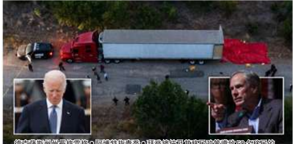
德克薩斯州州長格雷格·阿博特指責喬·拜登總統及其移民政策導致50名移民的死亡，他們的屍體被發現被遺棄在得克薩斯州酷熱的拖拉機拖車中

（休士頓/秦鴻鈞報導）週一在聖安東尼奧市郊的一輛廢棄拖拉機和拖車內發現了至少46具從墨西哥越境進入美國的移民的屍體。市政府官員在新聞發布會上說，至少16人活著被送往當地醫院，三人被捕，但患有中暑和明顯脫水，這是美國最嚴重的移民死亡事件之一。當天早些時候，警方正在尋找這輛車的司機，然後在市中心西南的鐵軌和汽車打撈場附近的偏遠地區發現了這輛卡車。麥克馬納斯指揮官說，卡車是被附近一家公司的一名工人發現的，這名工人發現拖車門部分打開，裡面發現了一些屍體。下午6點左右，在卡車內發現了包括男性和女性在內的大部分屍體，似乎患有中暑、熱衰竭。墨西哥外交部長表示，死亡人數已增加至50人。