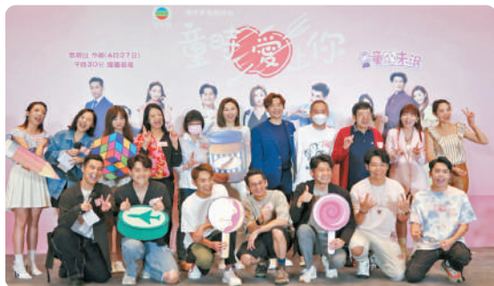
◆ 無綫新劇27日舉行大型宣傳活動。