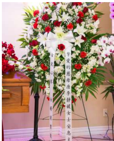
各界人士送来的悼念花圈。