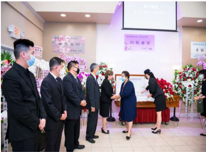
前来参加追悼仪式的亲友向唐家人致意。