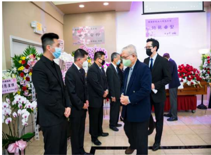
前来参加追悼仪式的亲友向唐家人致意。