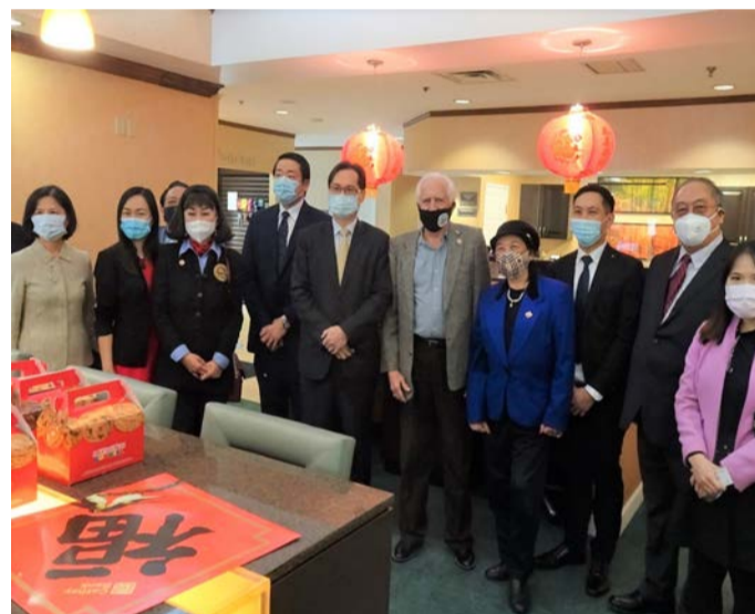
出席「糖城萬豪酒店」開幕剪綵儀式的貴賓合影。