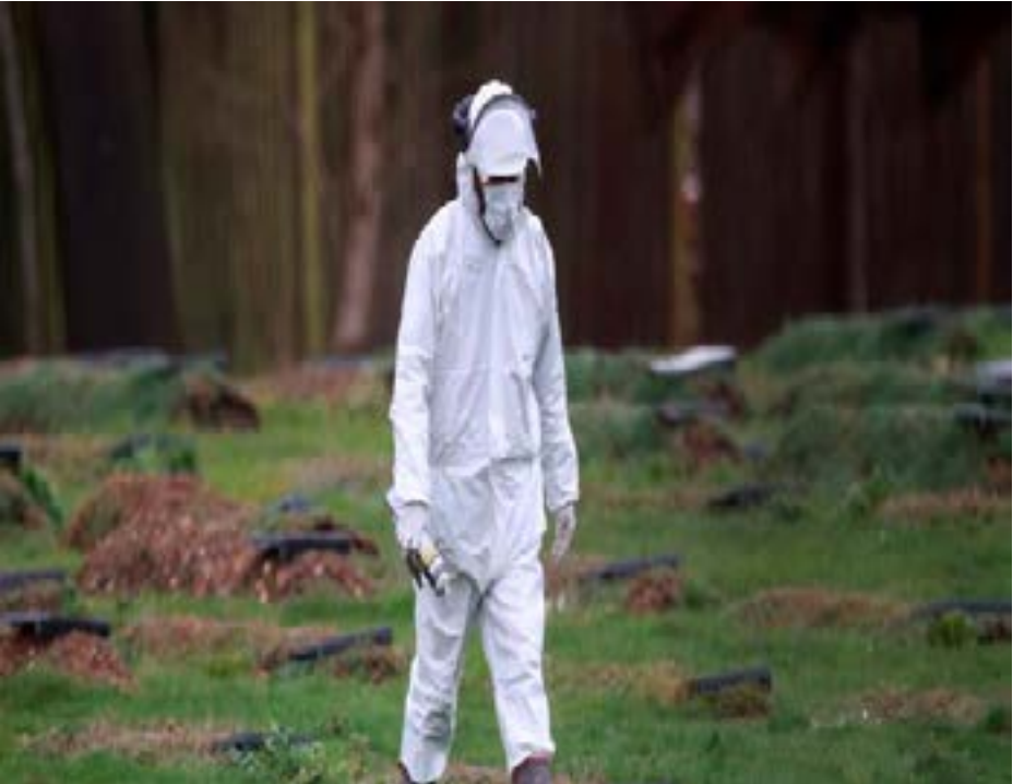
A worker wearing a protective suit walks at a cemetery in Chislehurst on the outskirts of London, Britain January 12, 2021.