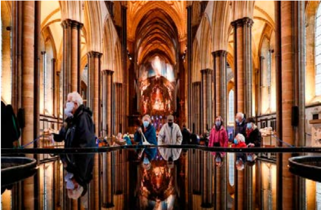
People wait to receive the coronavirus vaccine inside the Salisbury Cathedral, in Salisbury, Britain January 20, 2021.