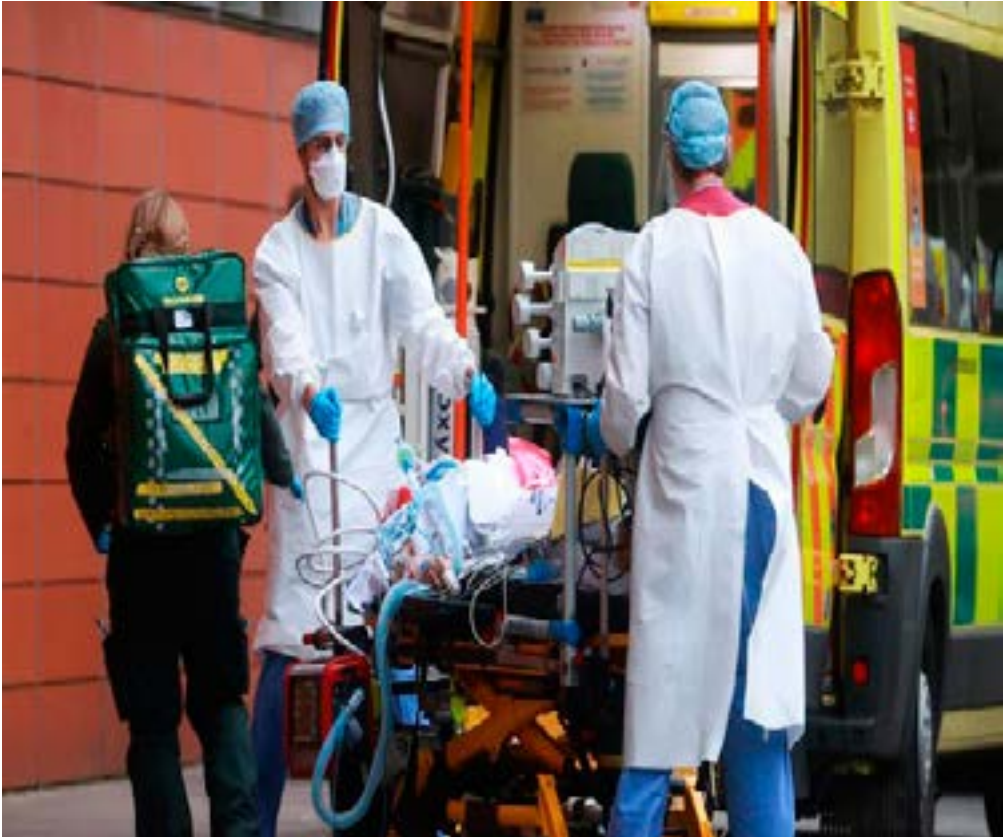
Health care workers transport a patient at the Royal London Hospital in London, Britain, January 19, 2021.