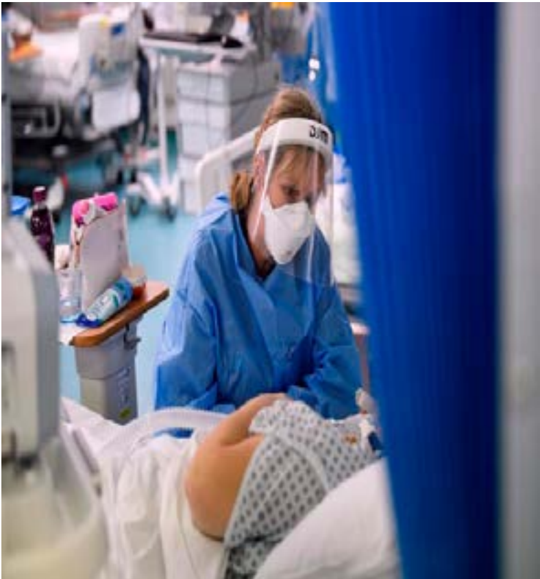
A nurse attends to a patient on a COVID-19 ward at Milton Keynes University Hospital in Milton Keynes, Britain, January 20, 2021.