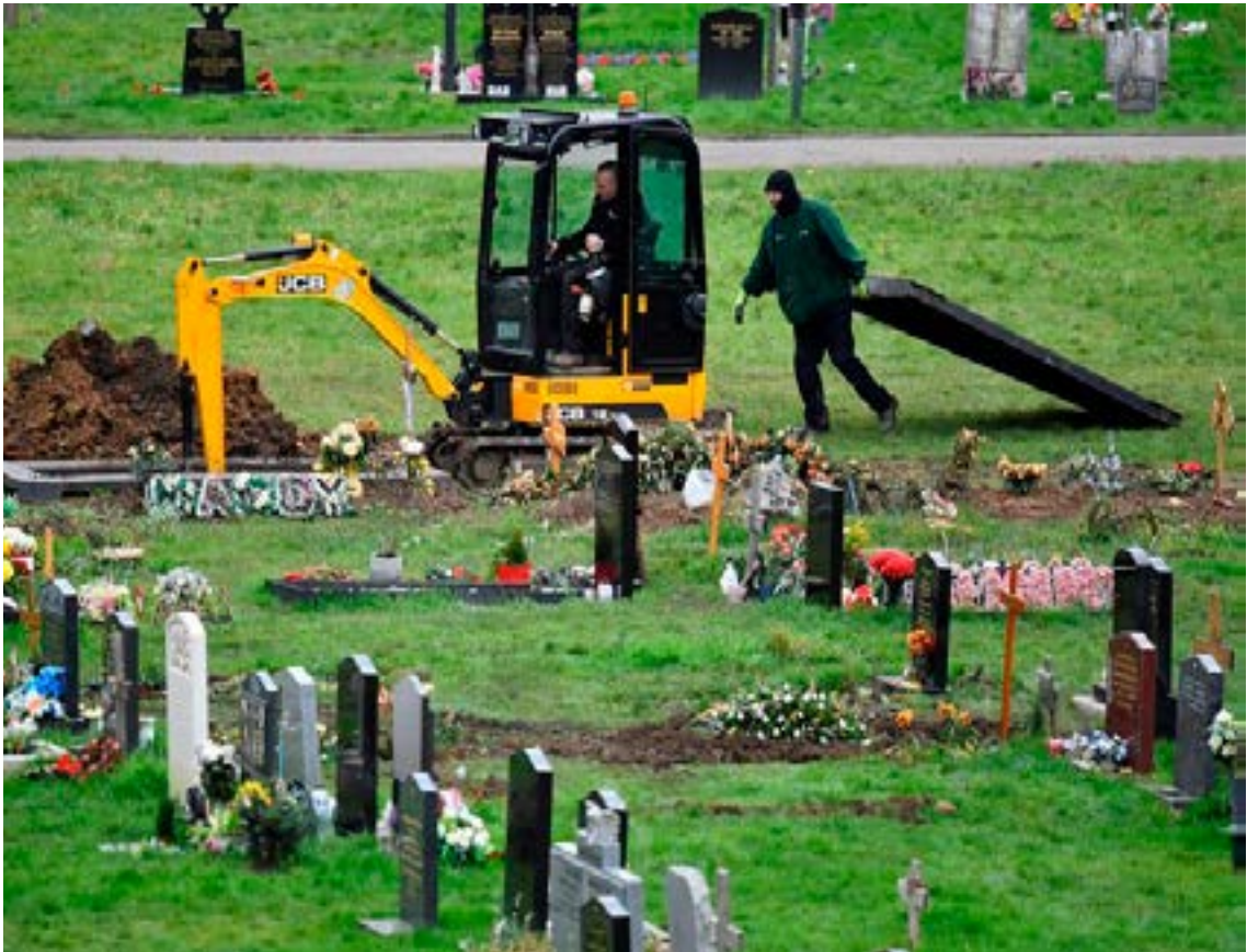
Workers dig graves at a cemetery, amid the spread of the coronavirus pandemic, in London, Britain, January 11, 2021.