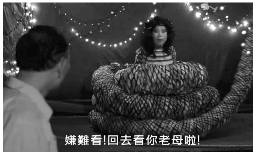
嫌難看!回去看你老母啦!

人家消音，他又舉例就像畫廊展出一幅裸女圖，他們會去把那張裸女圖露點部位遮住或塗掉嗎？強調自己真的很久沒這麼生氣了。