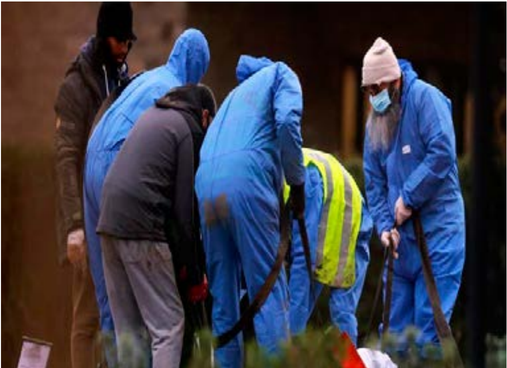
Workers wearing protective suits bury the body of a person at a cemetery in Chislehurst on the outskirts of London, Britain January 12, 2021.