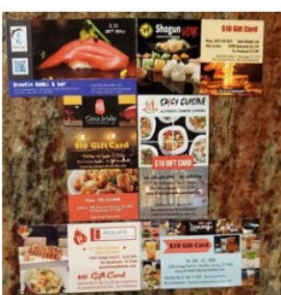
林城中國文化中心專門為參加暖心活動的6家餐館設計的禮卡。