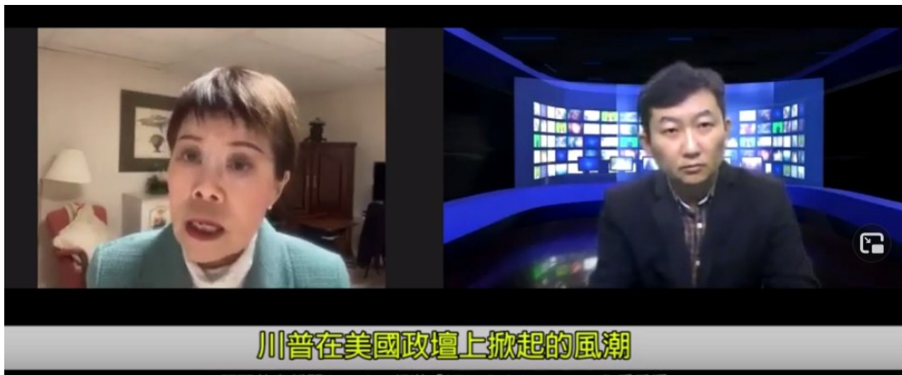
川普在美國政壇上掀起的風潮

(本報記者黃梅子) 拜登總統已於1月20日入主白宮，而川普雖然壹直堅持他贏得了勝利，指責民主黨舞弊並訴諸法律，但最後他不得不黯然神傷地離開了白宮。事實上，從2016年川普當選起，很多美國人就不接受這位非建制派總統。川普執政特立獨行，反對建制派和自由主義，要確保經濟復蘇，堅持與他國開展對等貿易，強化美國的軍隊建設，回歸美國精神，目標是保持“美國優先”或“美國第一”。作為政治素人，其崛起源於美國社會極化和國際秩序演進。目前民主黨人拜登雖然贏得了大選，但川普主義作為壹種社會思潮和現象，會繼續影響美國內政和外交。