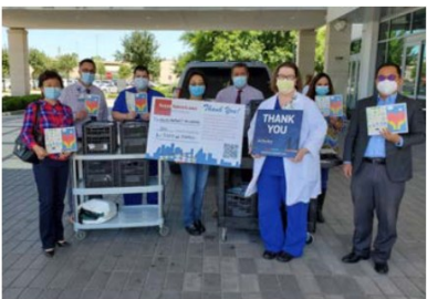
Methodist Hospital - Woodlands 收到 200份愛心午餐和200個暖心卡