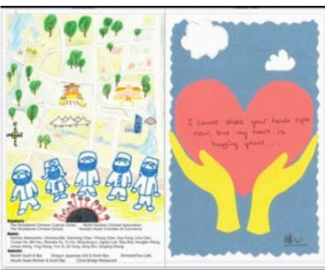
林城中文學校設計的暖心卡