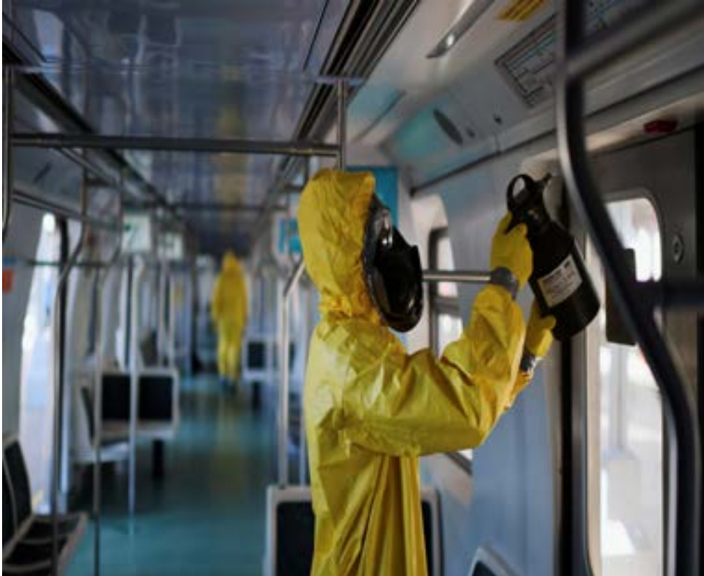
A member of the armed forces disinfects a train car during the coronavirus disease (COVID-19) outbreak, at the Brazil’s Central station in Rio de Janeiro