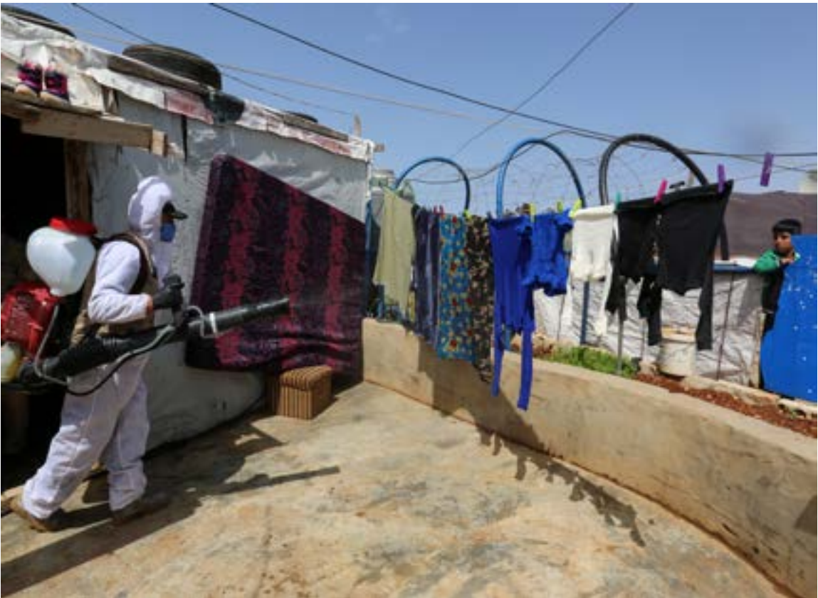
A worker from the municipality sanitizes Syrian refugee camp, as Lebanon extends a lockdown by two weeks to combat the spread of coronavirus disease (COVID-19) in Marjayoun