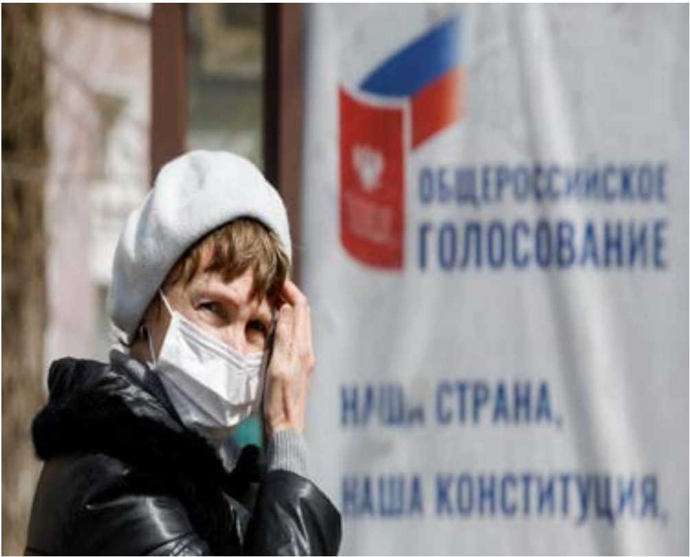
A woman wearing a protective mask near a board informing of a nationwide vote on constitutional changes in Stavropol