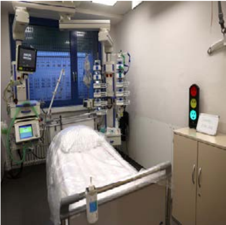
A general view shows an intensive care unit bed with a special artificial respiration device where patients with the coronavirus disease (COVID-19) could be treated in Hanau