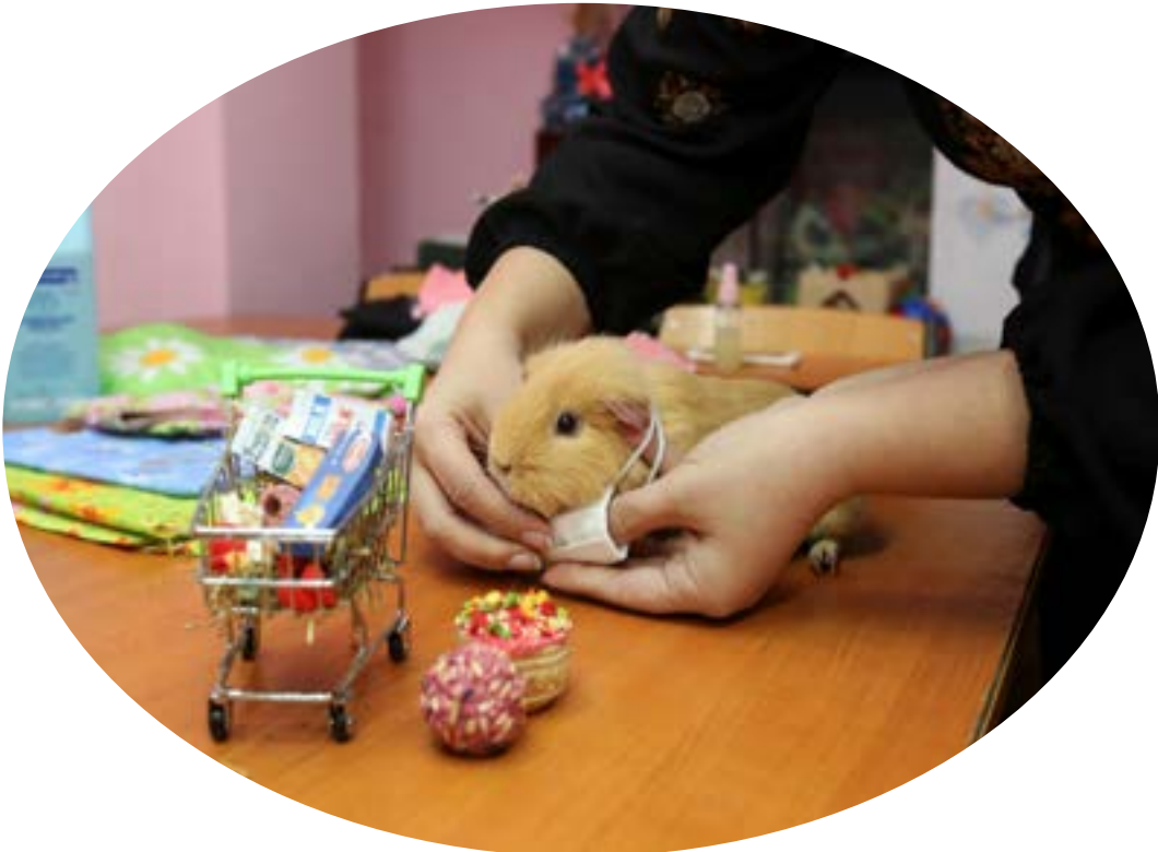
A view shows a guinea pig with a protective mask, widely used as a measure to prevent the spread of coronavirus disease (COVID-19), and a toy shopping cart during a demonstration in the office of a public organization, which recently launched the production of face masks for their further distribution among seniors and low-income citizens, in Kharkiv, Ukraine March 26,