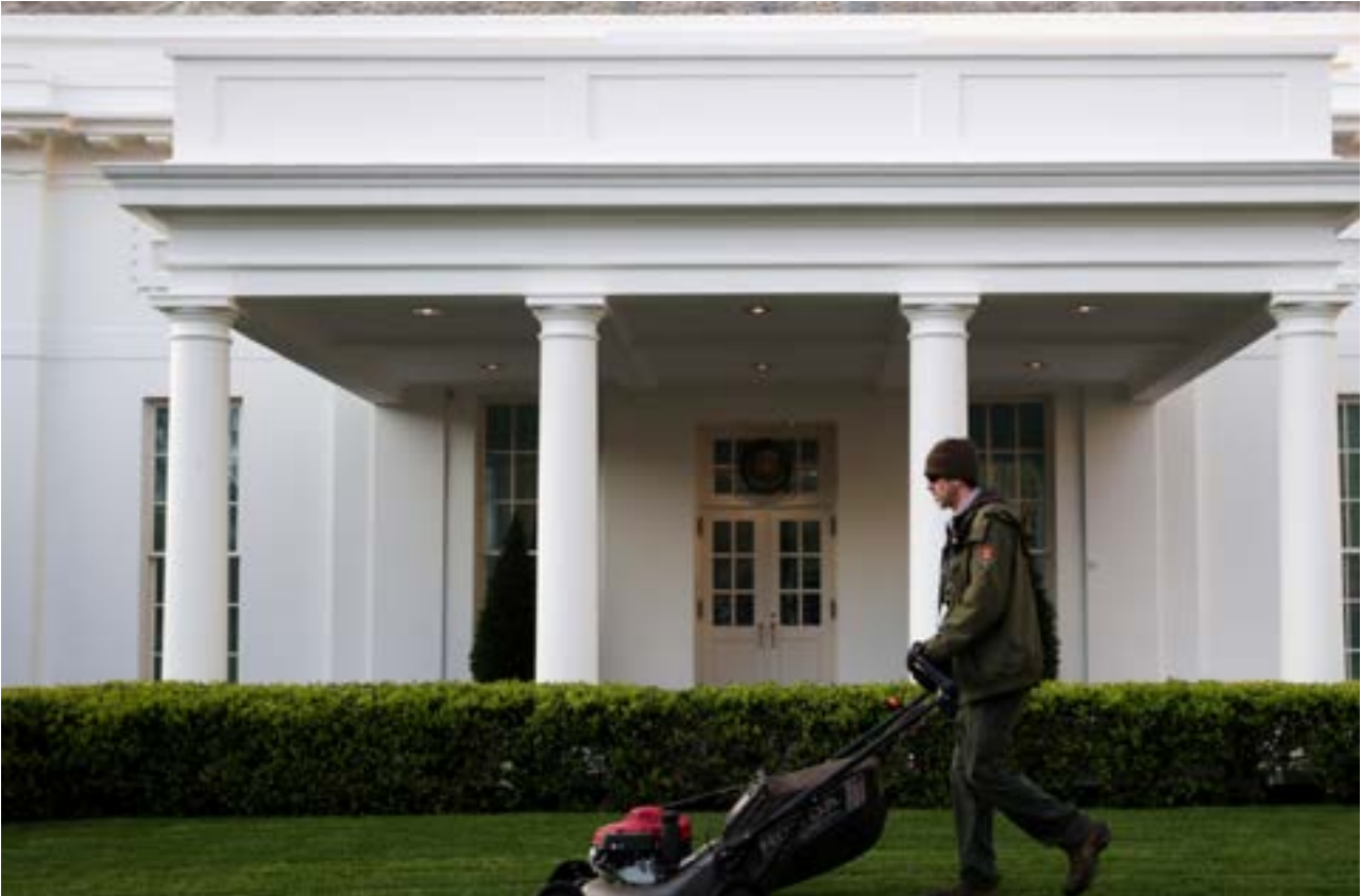
A National Park Service gardener mows the lawn as Trump prepared to join G20 leaders on a conference call about the global coronavirus response at White House in Washington

The data added to an alarming scenario spelled out by