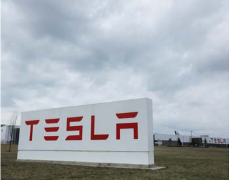
Tesla Inc. Gigafactory 2, which is also known as RiverBend, is pictured during the spread of coronavirus disease (COVID-19), in Buffalo, New York