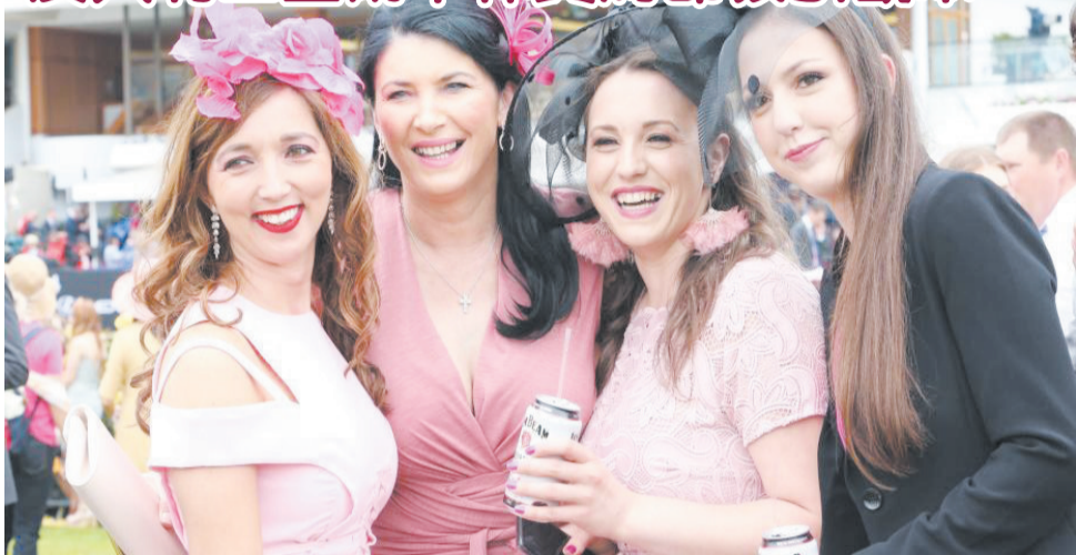
2018墨爾本杯賽馬節正在墨爾本弗萊明頓賽馬場舉行。這是澳大利亞最盛大的體育和時尚活動之壹，女士們喜歡身著各種時裝、頭戴各式帽子出席