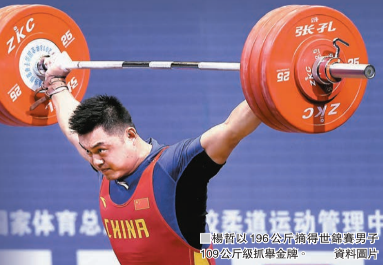
楊哲以196公斤摘得世錦賽男子109公斤級抓舉金牌。資料圖片