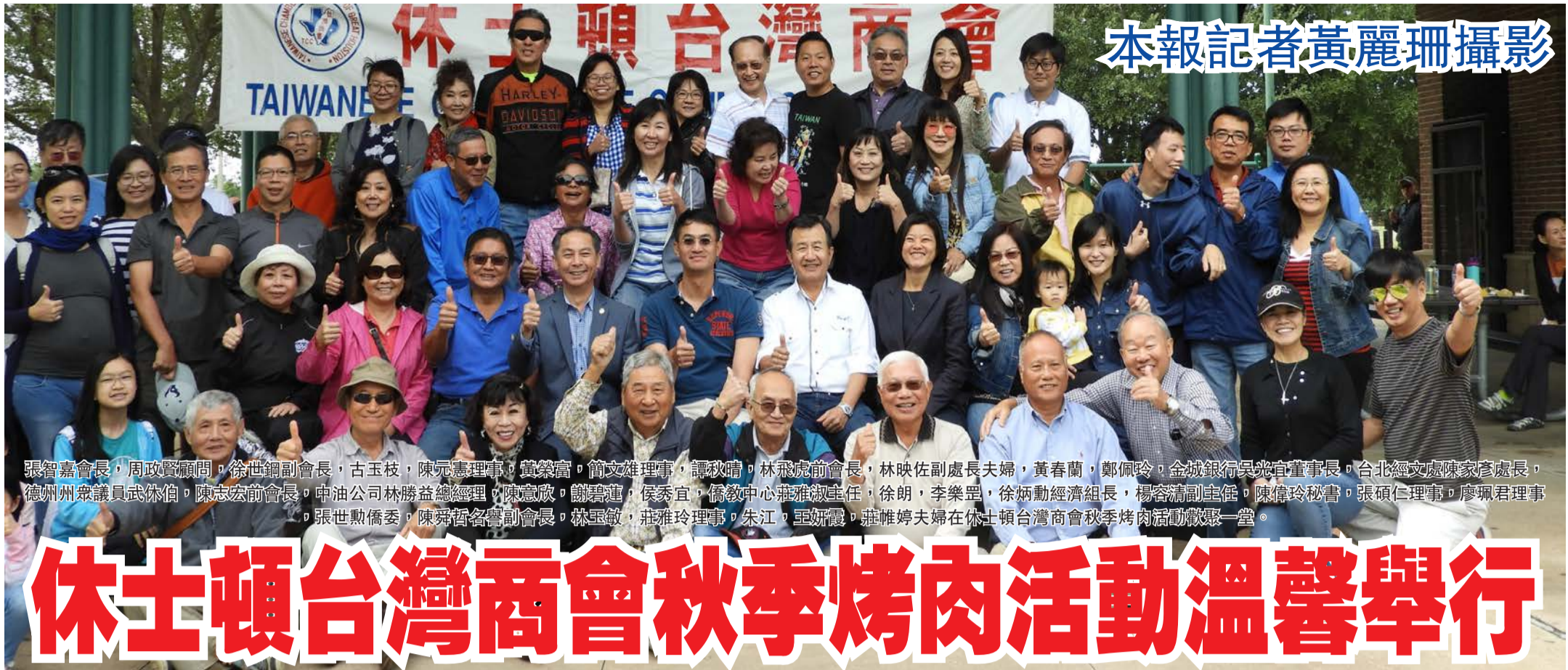
本報記者黃麗珊攝影