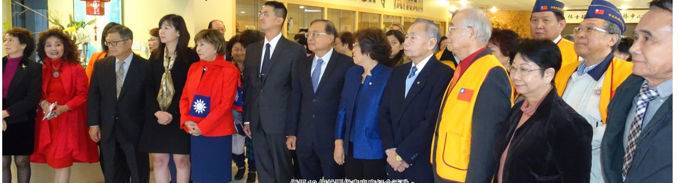
僑界18個社團代表出席紀念活動。