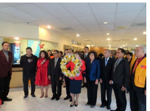
中山學術研究會委員們代表獻花。