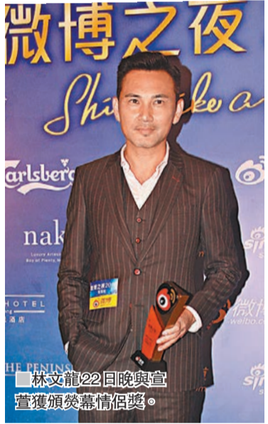
林文龍22日晚與宣萱獲頒榮譽情侶獎。