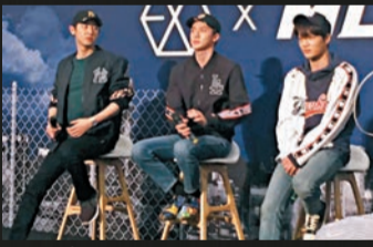
左起：Chanyeol、Sehun和Kai 23日赴港出席品牌活動。

演出，各有一台高清攝影機來分別捕捉成員們的動態，並同時分割成8個畫面，與之前的技術相比，更能傳神地向觀眾呈現EXO成員的外貌和演出盛況。