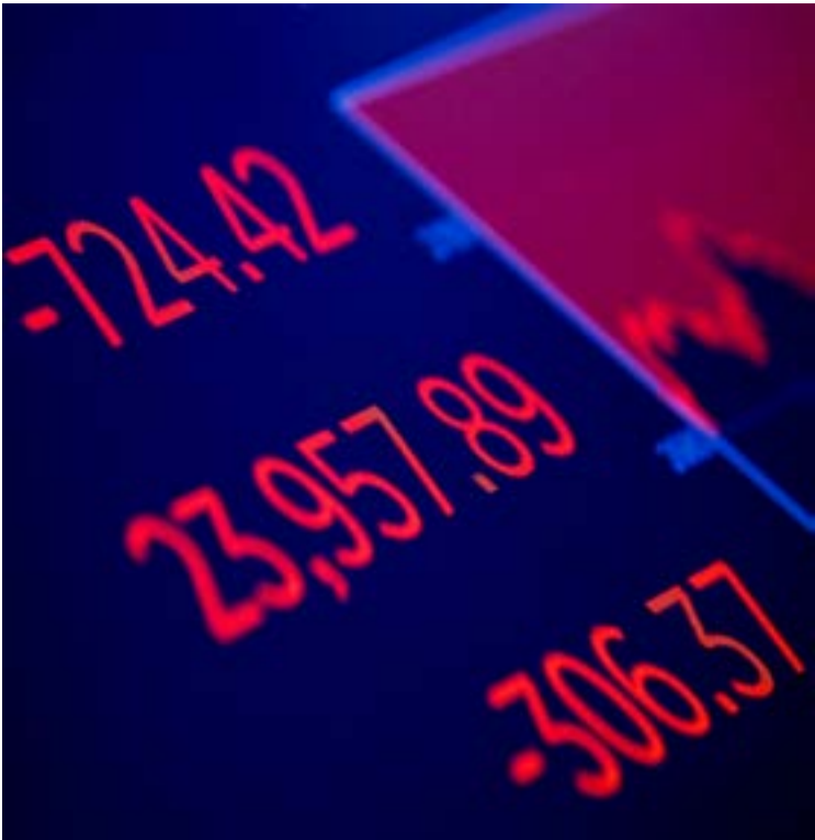
The Dow Jones Industrial Average is displayed on a screen after the closing bell, over the floor of the NYSE in New York