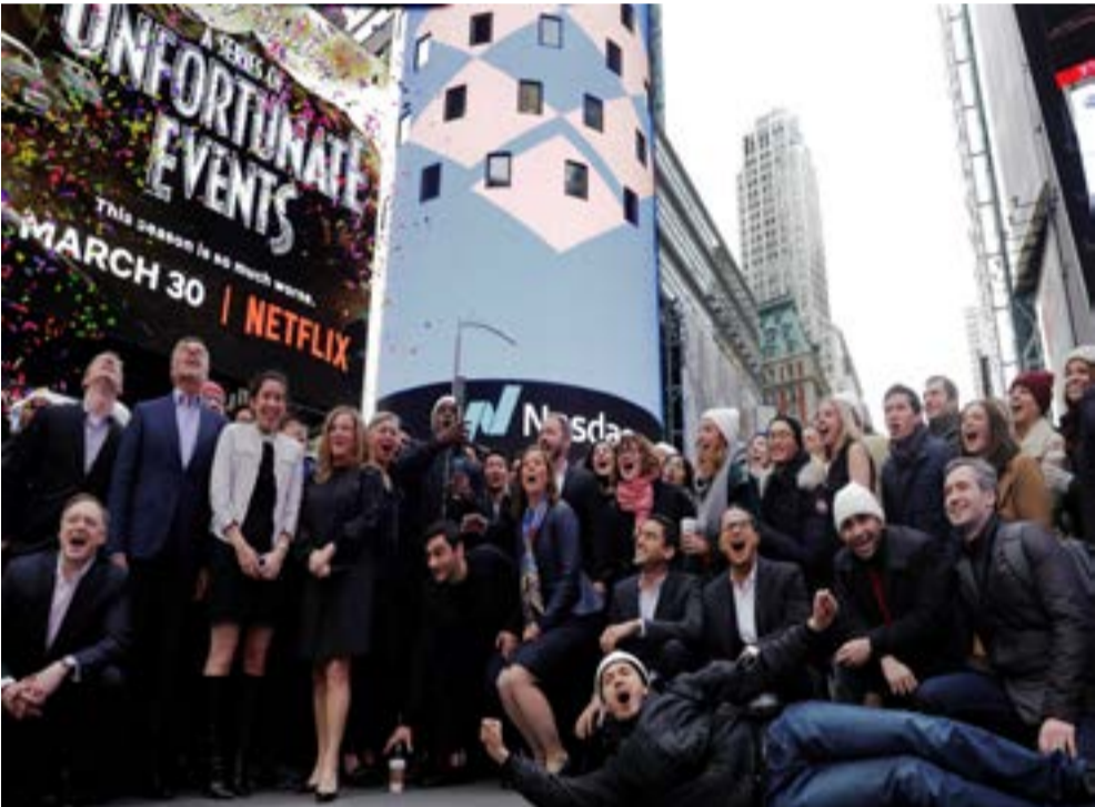
Dropbox Inc. co-founders stand outside with employees at Nasdaq as Dropbox (DBX) is listed for company's IPO in New York