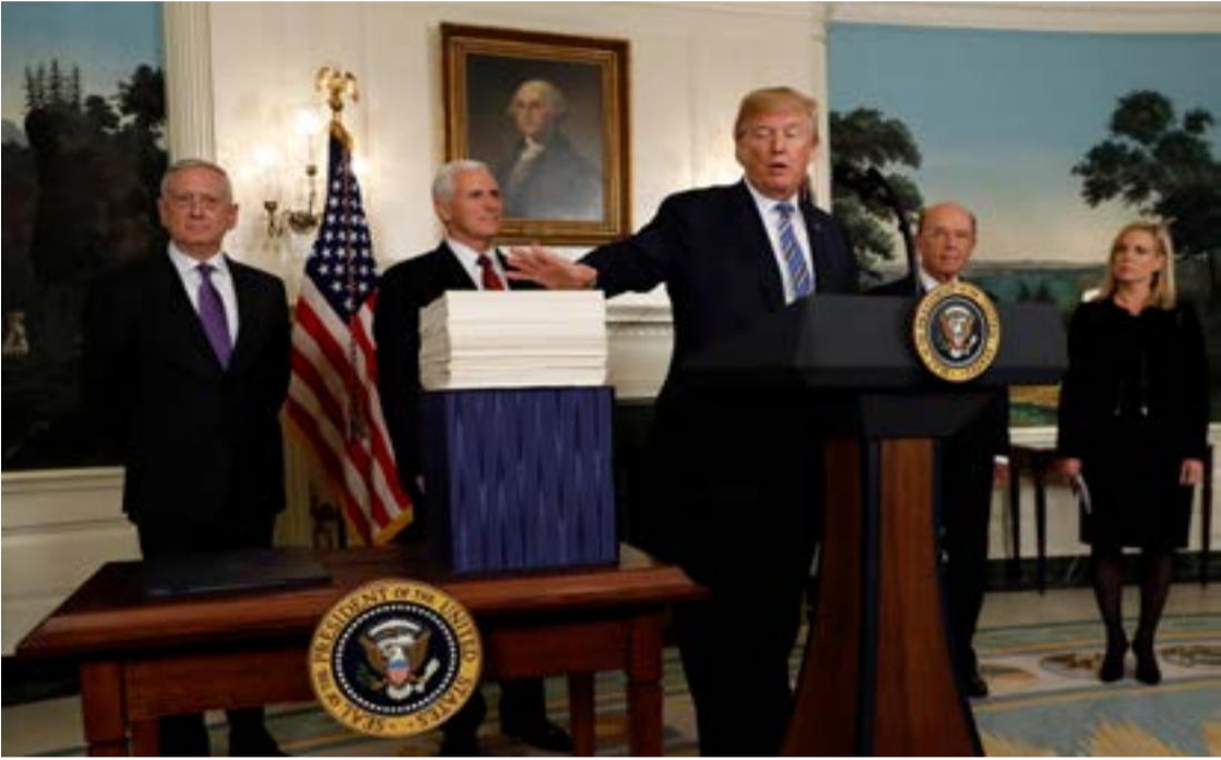
Trump speaks about Congress' spending bill at the White House in Washington

Trump canceled the Deferred Action for Childhood Arrivals (DACA) program that