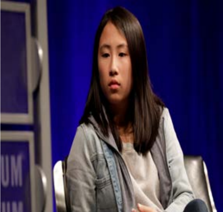
Student journalists of Marjory Stoneman Douglas High School participate in a discussion at Newseum in Washington