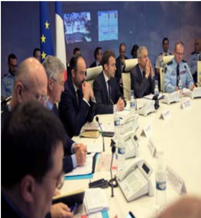
French President Emmanuel Macron and Prime Minister Edouard Philippe attend a videoconference in Paris