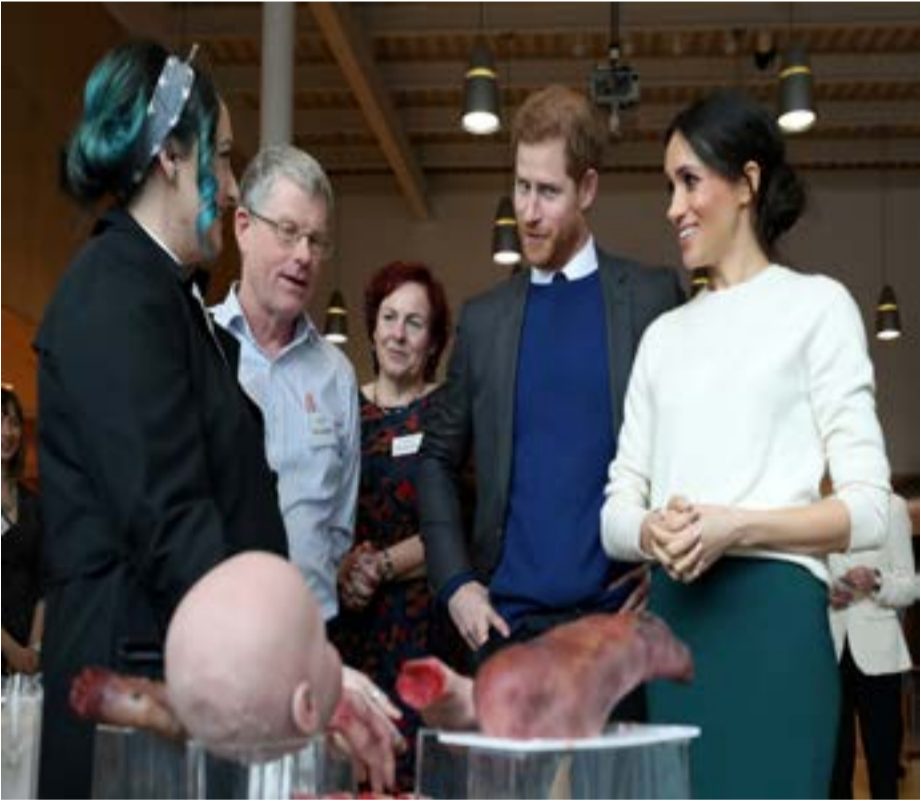
Royal visit to Northern Ireland