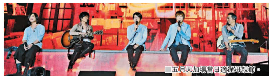
五月天加場當日適逢母親節。

首輪演唱會門票率先在本月19日優先訂購，反應非常熱烈，開賣當日已經全部爆滿，五月天得悉大家的支持，非常感動，而為了讓更多“五迷”能夠體驗這次戶外的演出，主辦單位決定將加開13日一場，滿足大家需求。而6場門票將於本月29日公開發售，當日剛好是五月天成軍21周年的紀念日，連續兩年都在成軍紀念日開賣香港站的門票。