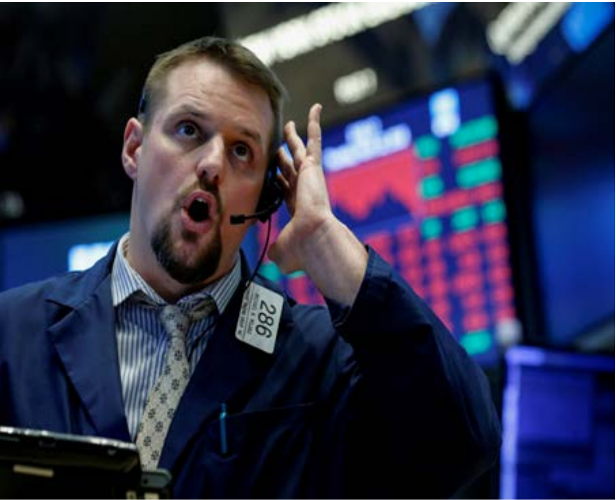
A traders works on the floor of the New York Stock Exchange, (NYSE) in New York, U.S., March 22, 2018.