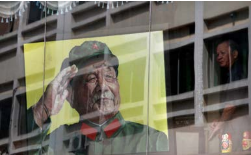
FILE PHOTO: A man looks out from a window next to a portrait of late Chinese leader Deng in a gallery at Dafen Oil Painting Village, in Shenzhen

tariffs Donald Trump’s decision to impose tariffs on steel and aluminium imports has fuelled fears of an escalating trade war and hit hard the share prices of Asian steelmakers and manufacturers supplying US markets. Pipeline manufacturing has grown in Texas over the past decade, as the hydraulic fracturing boom took off in shale plays like the Eagle Ford and Permian Basin. In November, global steel pipe giant Tenaris began production of steel oil and gas pipe at its new $1.8 billion mill in Bay City, destined for shale oil and gas wells in Texas, Oklahoma and beyond. But a relatively small amount of that pipe goes to China. U.S. steel pipe exports reached 832,000 metric tons last year, according to the U.S. International Trade Administration. More than 80 percent of that