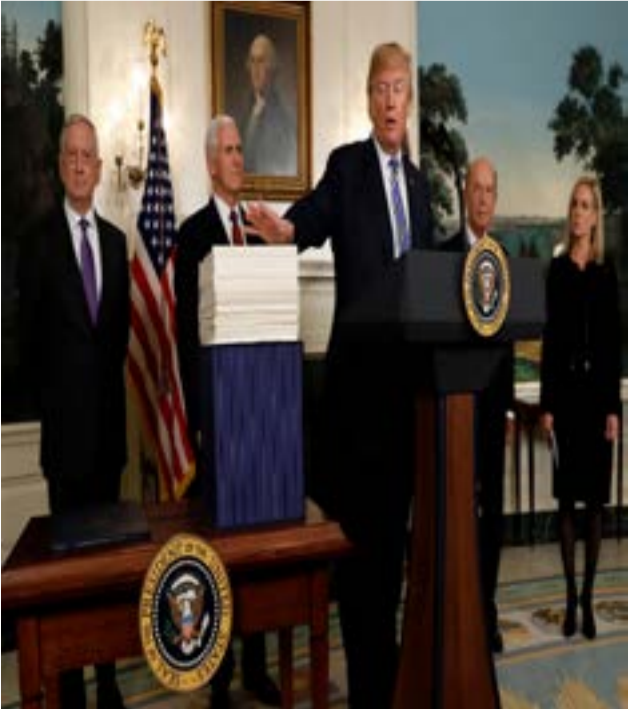
Trump hosts spending bill signing ceremony at the White House in Washington