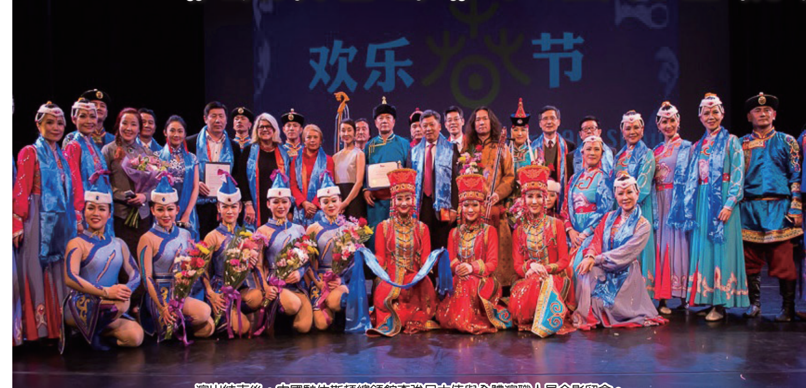
演出結束後，中國駐休斯頓總領館李強民大使與全體演職人員合影留念。