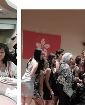
休斯頓香港會館2017年金雞賀歲所有演出人員合影。