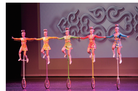
技藝高超的雜技表演《高空踢碗》。