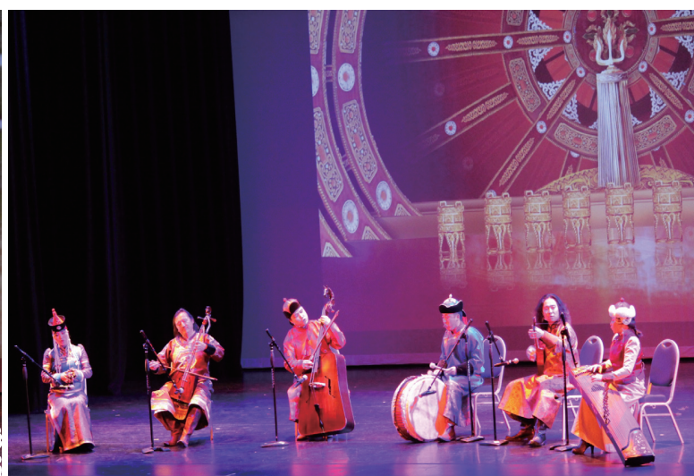
艾拉古組合表演《祈福》。