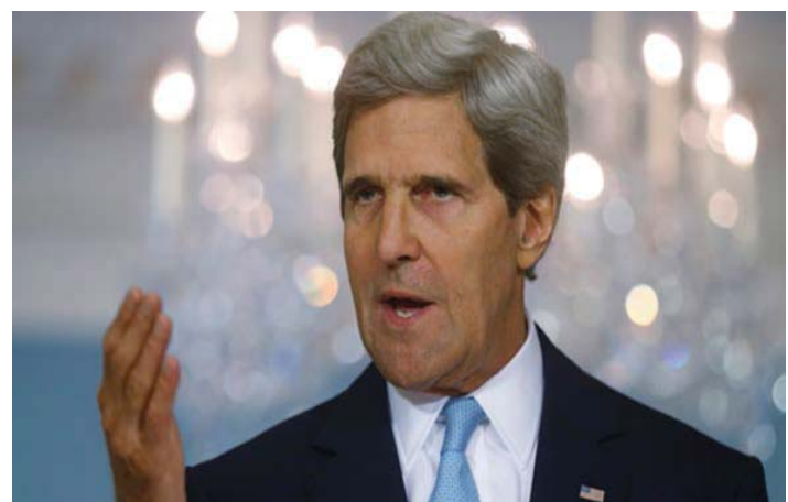
John Kerry is the first ever US secretary of state to visit Hiroshima, obliterated by an American atomic bomb in 1945.