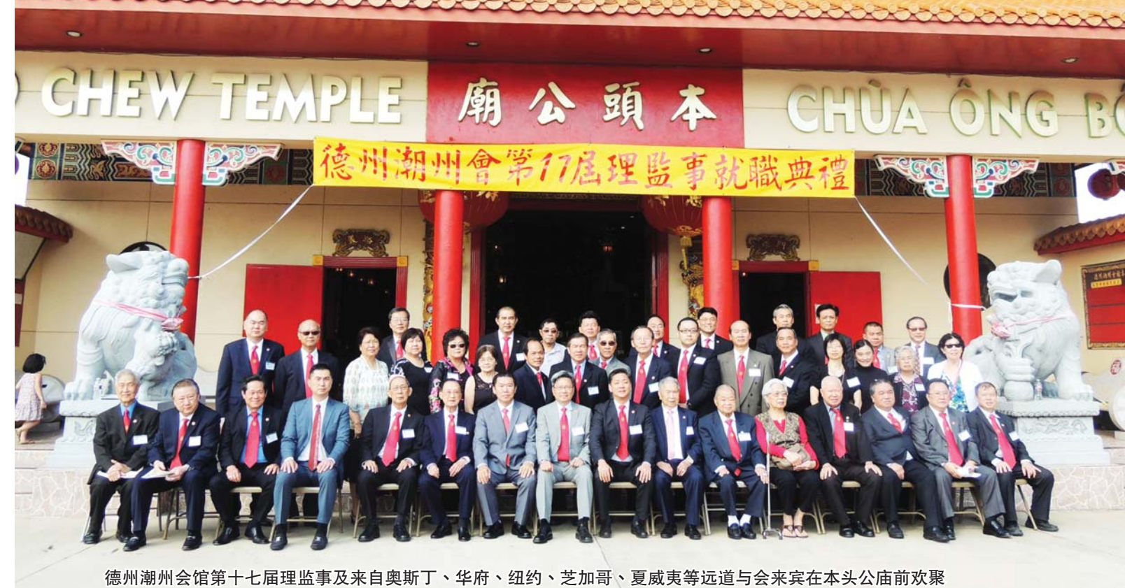
德州潮州会馆第十七届理监事及来自奥斯丁、华府、纽约、芝加哥、夏威夷等远道与会来宾在本头公庙前欢聚