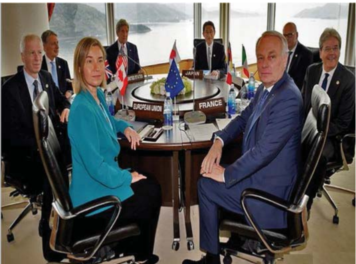
Members Of The G7 Foreign Ministers Pose For Photo In Private Meeting

US Secretary of State John Kerry arrived earlier Sunday at a US military base in Hiroshima. He had flown from Afghanistan, briefly stopping over in Iraq and Bahrain.