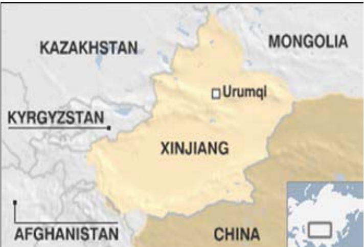
China's Far Western Region Of Xinjiang

freedom among Chinese citizens in choosing their own religion, their leadership maintains a "tight reign" on regulating the religious institutions' activities and operations. The outlet said that China is mostly concerned about the emergence of Islamists, whom Xi referred to as "extremists," that have been causing havoc in the country's far western region of Xinjiang. Over the past years, violence caused by the conflict between the Han Chinese that compose the majority and the Muslim Uyghur minorities has resulted in hundreds of deaths. In response, officials opted to increase efforts in banning traditional Islamic religious observances like growing beards and wearing veils.