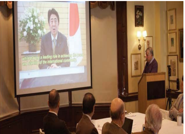
Japanese Prime Minister Abe Speaks To G7 Ministers Meeting In Hiroshima Via Satellite.

China has pressed Japan not to broach Beijing's disputes with regional neighbors in the South China Sea at the upcoming Group of Seven summit to be held in Japan in May.