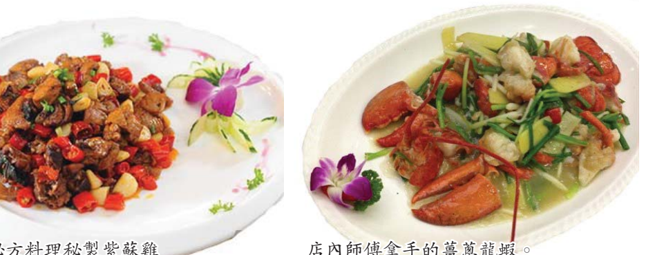
店家秘方料理秘製紫蘇雞 店內師傅拿手的薑蔥龍蝦