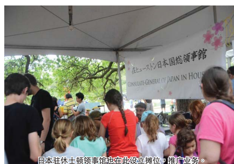
日本驻休士顿领事馆也在此设立摊位，推广业务。