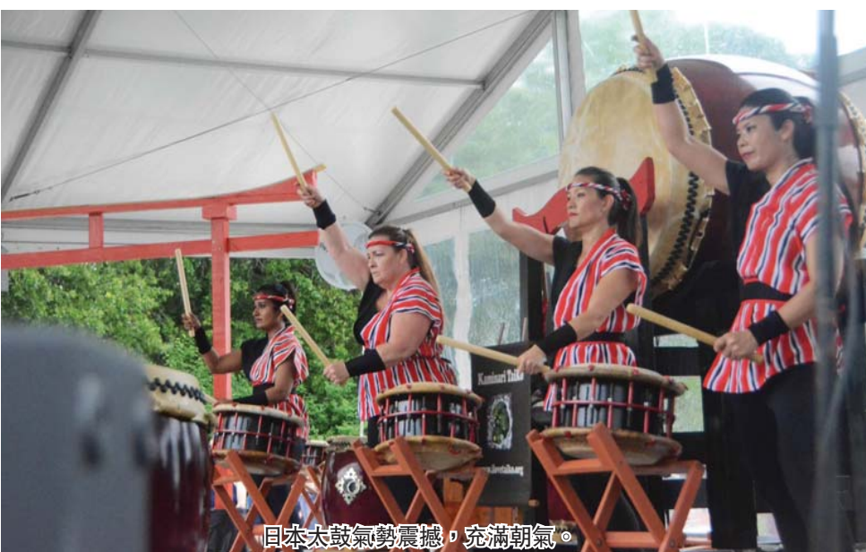
日本太鼓舞队表演，充满朝气。