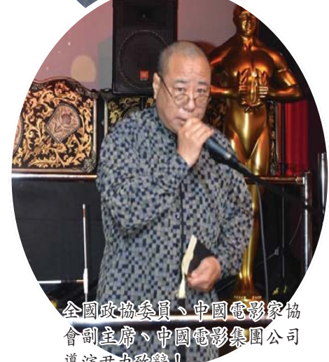
全景中国组委会、中国电影节组委会副主席、中国电影节组委会副主席尹力致辞。