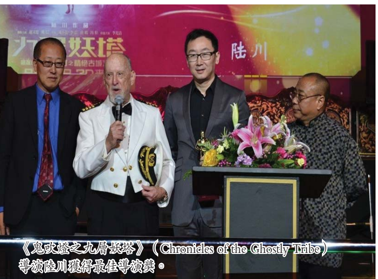
《鬼眼怪之恐怖传说》(Chronicles of the Grimy Tale) 导演陆川现场最佳导演。