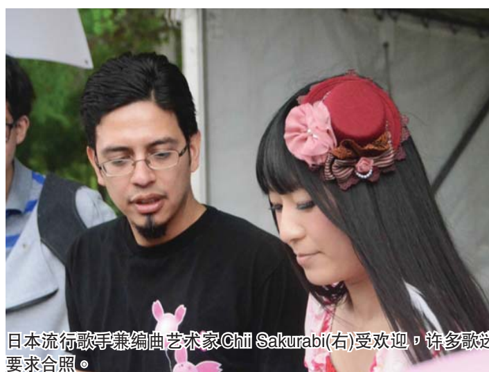
日本流行歌手兼编曲艺术家Chi Sakurabi(右)受欢迎，许多歌迷要求合照。