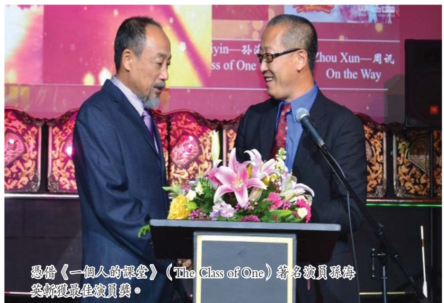
电影《一个人的回忆》(The Class of One) 著名演员陆川现场最佳导演。