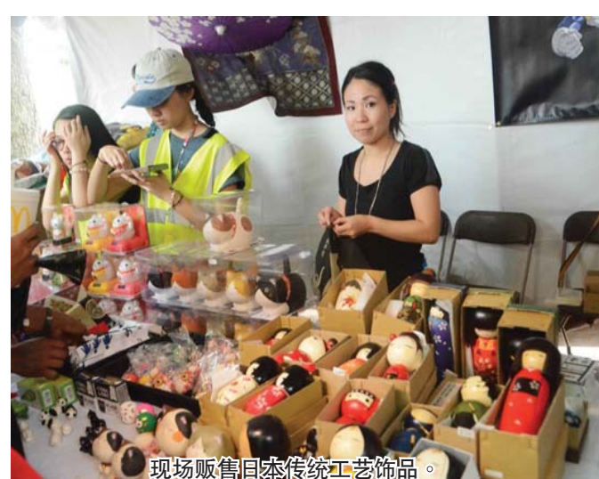
现场贩售日本传统工艺品。