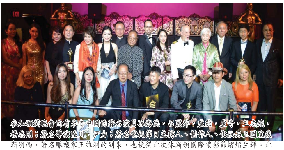
参加颁奖典礼的有来自中国的著名演员陆川、王学兵、王学兵、杨烁、著名导演陆川、沙力、著名电视制片人、制片人、张继忠王国立、新羽西，著名雕塑家王雅利也到场参与中国夜颁奖典礼。此次全景中国的部分剧组人员也到场参与中国夜颁奖典礼。