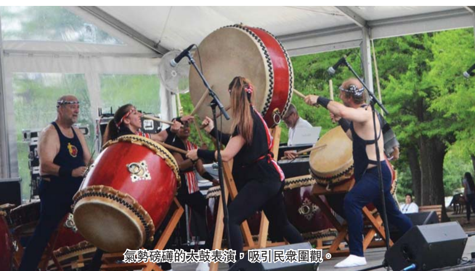
鼓乐舞队的太鼓表演，吸引民众围观。