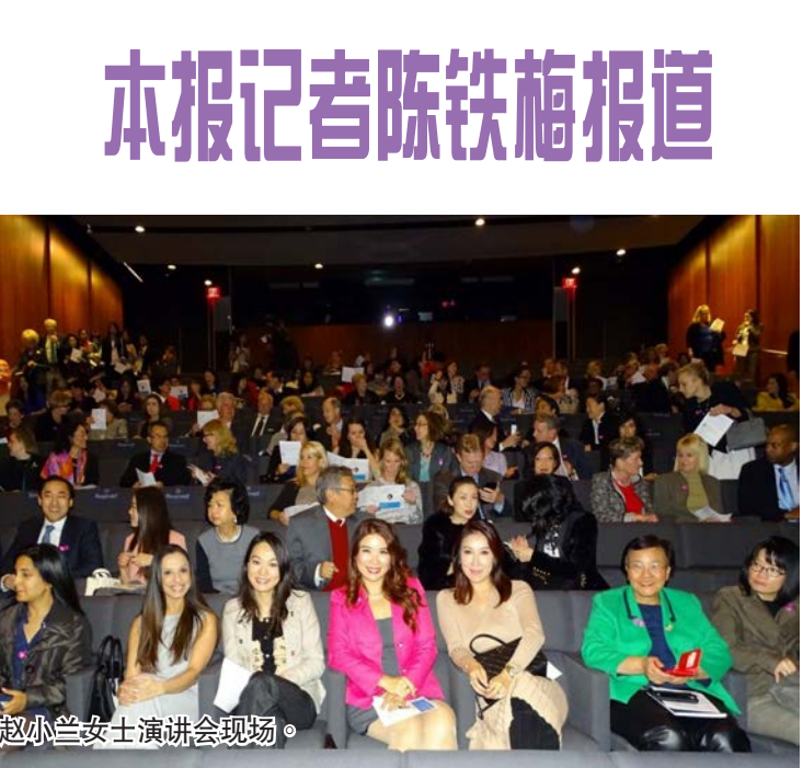
赵小兰女士演讲会现场。