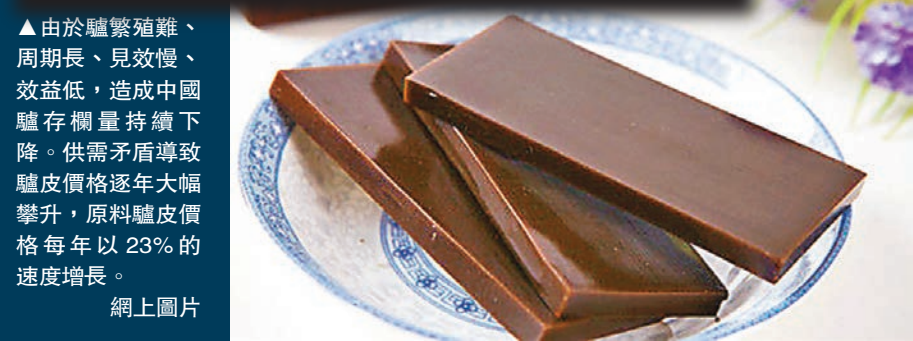
▲由於驢繁殖難、周期長、見效慢、效益低，造成中國驢存欄量持續下降。供需矛盾導致驢皮價格近年大幅攀升，原料驢皮價格每年以23%的速度增長。