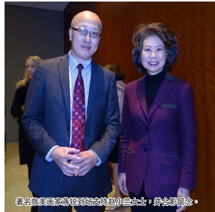
著名旅美国家政要魏家支持赵小兰女士，合影留念。