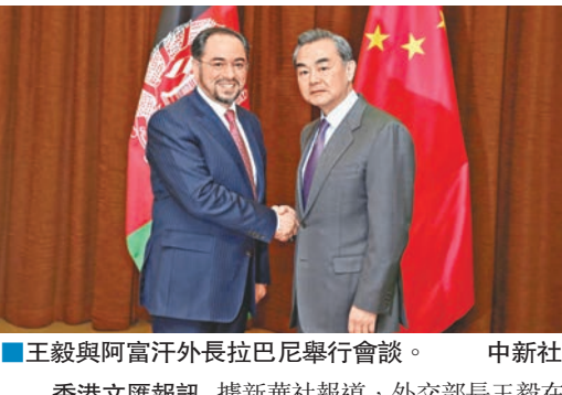
■王毅與阿富汗外長拉巴尼舉行會談。

香港文匯報訊 據新華社報道，外交部長王毅在北京與來訪的阿富汗外長拉巴尼舉行會談，雙方達成六項共識，其中提到，處於反恐前沿的阿富汗希望早日成為上合組織正式成員，中方表示重視和歡迎。王