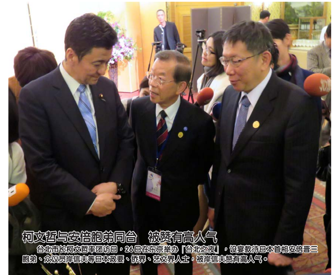
柯文哲与安倍胞弟同台 被赞有高人气 台北市市长柯文哲昨日,26日在东京参加「台北之夜」,设置期待日本首相安倍晋三胞弟、众议员岸田文夫等日本政要、侨界、艺文界人士,被岸田夫妻赞有高人气。

新加坡「天金集团」,号称「瑞士PAMP」实体黄金卖给民众,两年保证原价买回,结果黄金证书被查出不是,集团吸金上亿。桃园地检署今天起诉谢姓董事长20多人。 被告声称販售「瑞士PAMP」黄金产品,但检方却查出证书有造假,瑞士PAMP也函覆有些黄金是幽灵序号,查扣的近200块黄金成色也不足。 检方指出,新加坡「天金集团」56岁谢姓董事长自民国102年起在台湾,以高于市价1倍、号称「瑞士PAMP」实体黄金卖给民众,除每月可领1%利息,2年后公司保证原价将金块买回,全台吸收会员会入会再拉下线。 谢男吸收有10多年传销经验的老手加入,为了规避多层次传销规定,以成本新台币8000元的保养品充当「黄金保养品」,要求会员先花8千元购买才能取得经