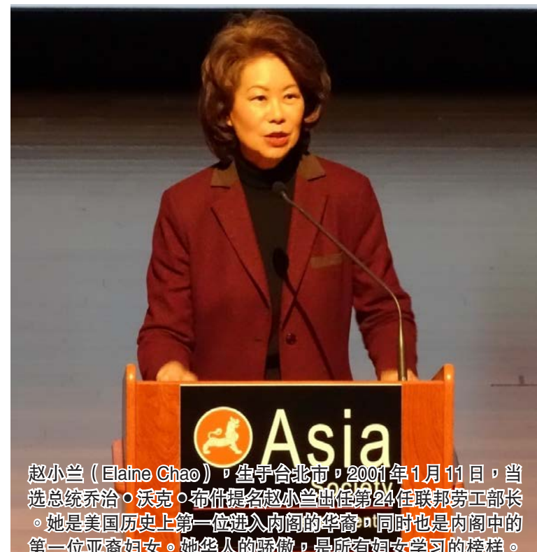
赵小兰(Elaine Chao)，生于台北，2001年1月11日，当选总统乔治·沃克·布什提名赵小兰出任第24任联邦劳工部长。她是美国历史上第一位进入内阁的华裔，同时也是内阁中的第一位亚裔妇女。她华人的骄傲，是所有妇女学习的榜样。