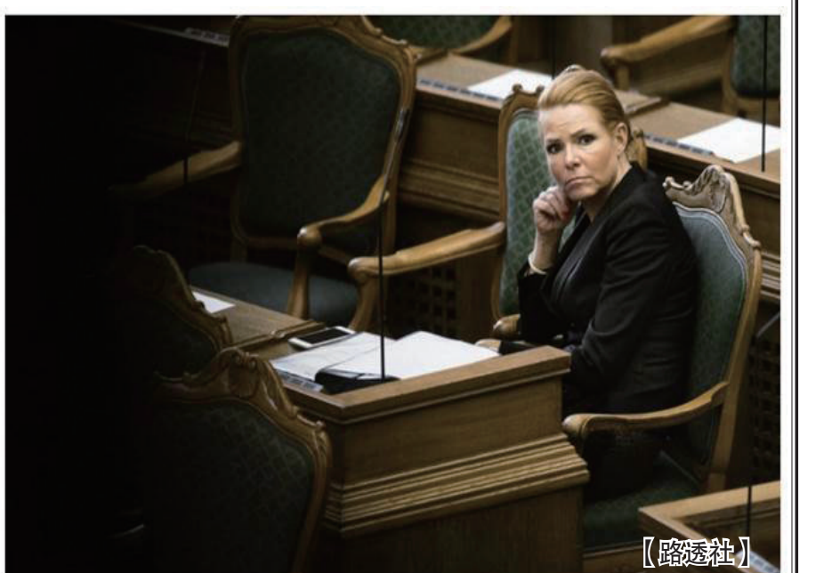
Denmark's Minister of Integration Inger Støjberg listens to the Danish Parliament debate a Danish law about seizing immigrants' assets, in Copenhagen on Tuesday.

【中央社】丹麦国会今天通过新移民法，允许警察没收难民贵重财物并延长难民家属依亲时间，受到国际争议，事实上瑞士与荷兰已有类似法律，这个发展也显示欧洲对难民问题立场出现改变。 根据新法律，申请庇护者抵达丹麦后，警方可以对他们的行李及衣服进行搜索，凡是价值超过1万克朗(约1340欧元，1450美元)的物品，例如手表、手机及电脑等，将被没收，但具有纪念价值的结婚戒指等例外，银行的存款则不会被没收。 丹麦政府强调，这些没收的财物将用来支付难民的食物及住宿费用，这个法律的精神与丹麦对国内的申请社会福利者一样，必须先使用他们自己的收入，才能申请福利津贴。 另一方面，庇护者如果要申请海外家属到丹麦团圆，必须等3年才能提出申请。不少难民在得知国会通过新法后难过的痛哭，担心与家人相聚的日子更遥遥无期，联合国则表达关切与遗憾。 事实上瑞士政府已要求外国移民抵达后必须申报财产，任何价值超过1000瑞士法郎(约992美元)的物品都会被没收，但有纪念性的物品例外，总计2015年瑞士政府共从112名移民没收了21万瑞士法郎。 另一方面，荷兰政府也要求申请庇护者必须申报财产，如果个人财产价值超过5895欧元，或全家人超过1万1790欧元，可以申请扣除，一旦移民开始工作，定居荷兰期间就必须支付所得税。 位在德国南部的巴伐利亚邦(Bavaria)也要求，难民入境后持有价值超过750欧元的现金或物品都必须被没收，官员指出，这个做法是仿效瑞士；德国西南部的巴登符腾堡邦(Baden-Wuerttemberg)，难民只能保有价值350欧元的物品。