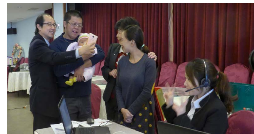
手机软体协助 一听障人士也能打电话 中华民国聋哑联合会26日获科技业者捐赠「随译通」手机软体服务平台,让听障朋友透过客服中心手语翻译人员的转译,也可像一般人一样打电话。

同案被告古梅峰则表示,顶新的油未精炼前即可吃,一审判决无罪,是因为油没问题,一审法官也曾到屏东实地勘查200吨大油槽,外观、味道