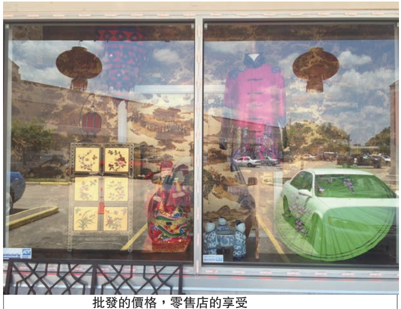
批發的價格，零售店的享受

木蘭盛唐，千古流芳。位於好運區的木蘭亞洲商品批發店在這條批發街上顯得格格不入。精致的產品，精心的裝飾和熱情的服務於其他批發店大為不同。置辦年貨，亞洲餐廳/裝潢配飾，寺廟裝扮佛堂，木蘭貨品之全，只有你想不到沒有你買不到。最近，木蘭搬家到6865 Harvin Dr, Houston, TX Toll Free: 1-888-778-4888Tel: 713-339-2802Cell: 713-922-8216 Web: www.mulan-asianmarket.com 新店面，新擺設，特添加亞洲服飾——如旗袍，紗衣，絲巾等都是獨一無二的設計。歡迎大家前去選購，給有大力折扣等著大家。