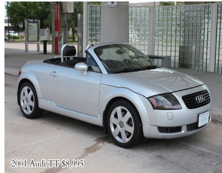
2001 Audi TT $8,995