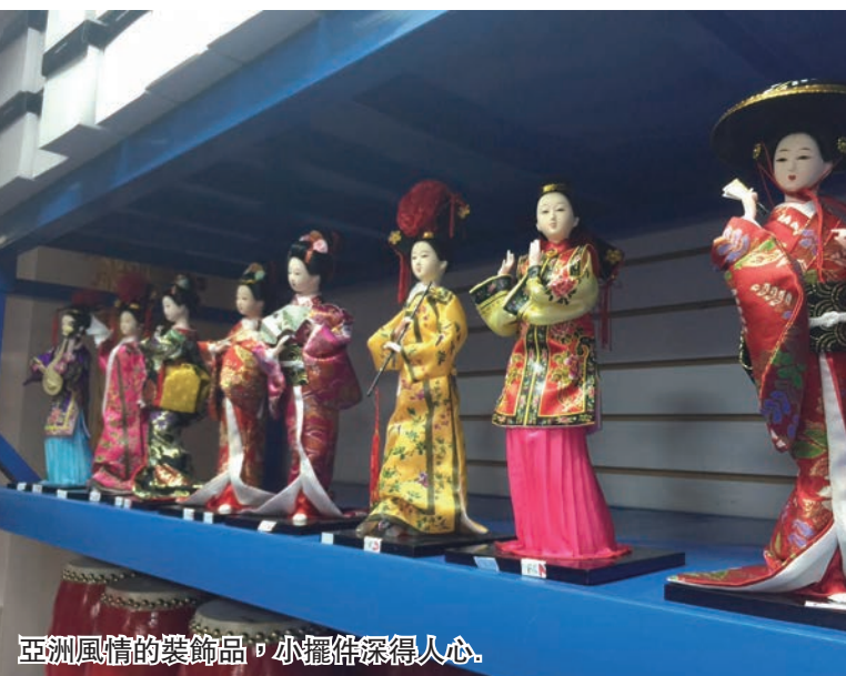
亞洲風情的裝飾品。小擺件解渴人心。