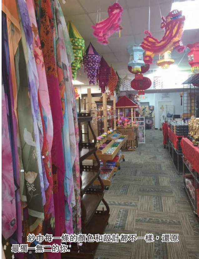
紗巾每一條的顏色和設計都不一樣，還原最細一無二的你。