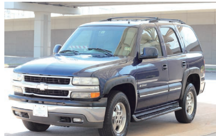
無論是日本車，德國車，美國車還是韓國車，CUBE AUTO SALES 的收購價格一定讓您滿意。