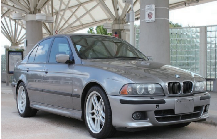
2003 BMW 540i $10,995