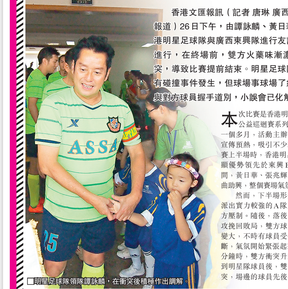
■明星足球隊與廣西東興隊先禮後兵。