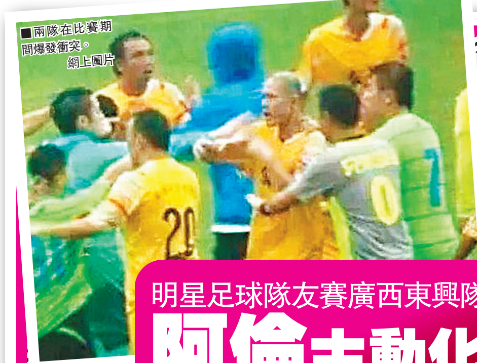
■兩隊在比賽期間爆發衝突。網止圖片