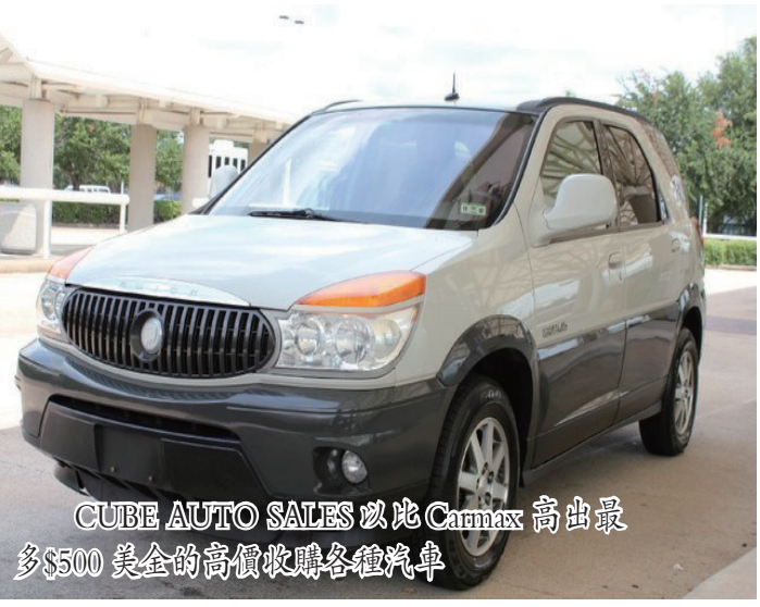
CUBE AUTO SALES 以比 Camax 高出最多$500 美金的高價收購各種汽車