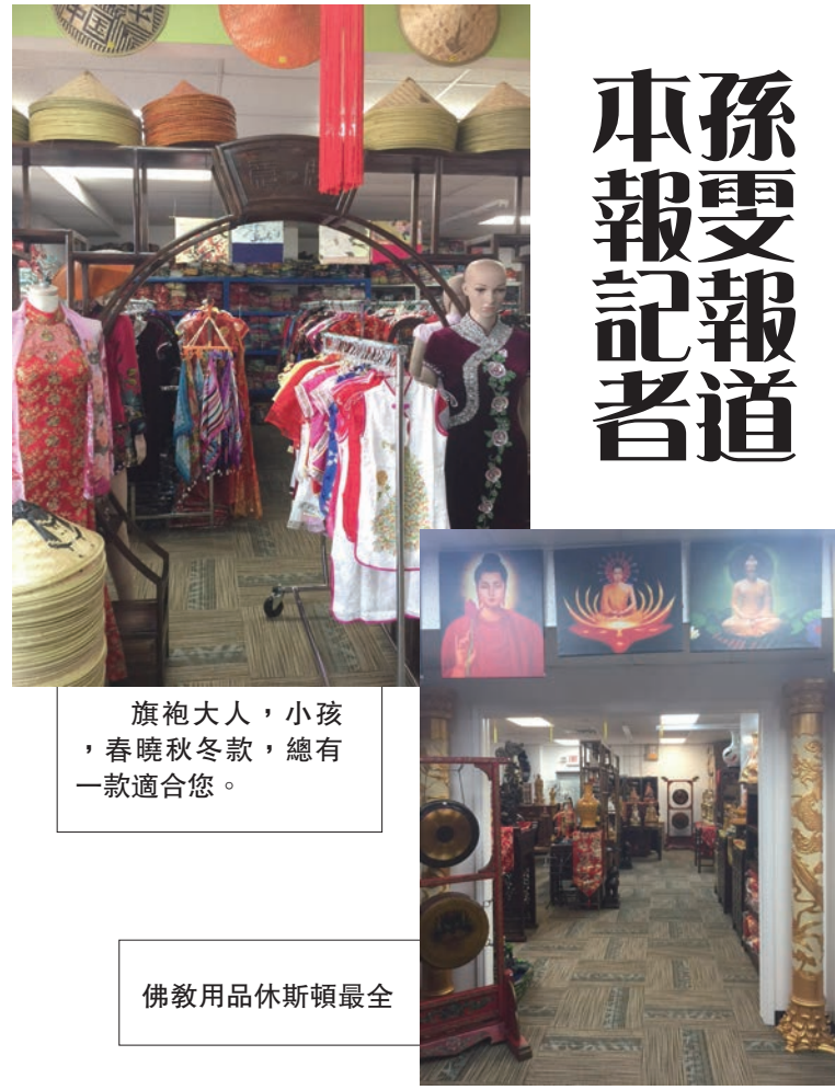
旗袍大人，小孩，春曉秋冬款，總有一款適合您。