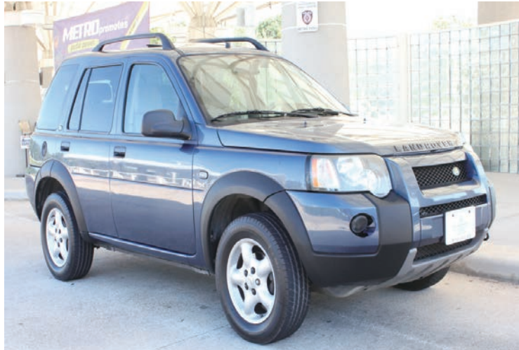
CUBE AUTO SALES 高價收購各種汽車