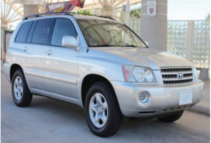
2003 Buick Rendezvous CXL $4,995