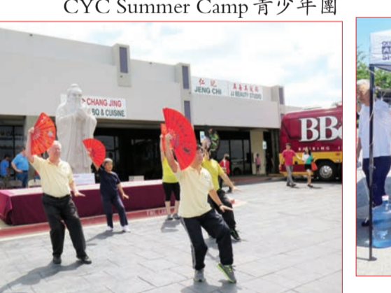
海華中文學校太極扇表演