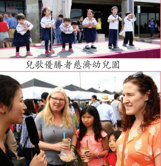
美國朋友接受走進美國記者採訪