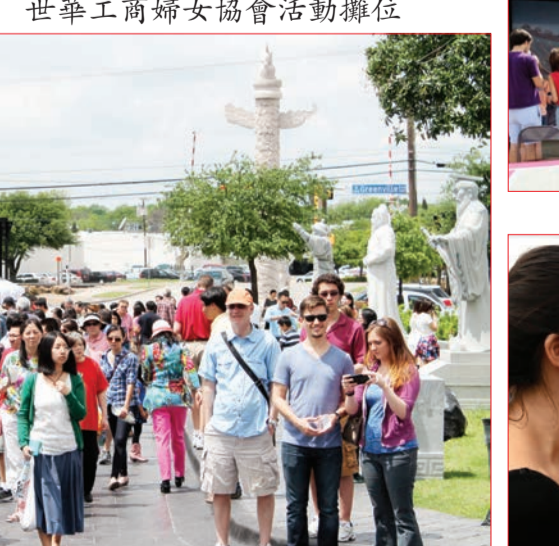
美國朋友接受走進美國記者採訪