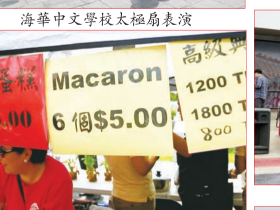
世華工商婦女協會活動攤位