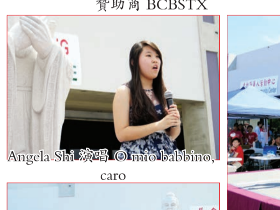
Angela Shi 敬唱 ©miolabbino, caro