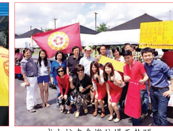
成大校友會攤位場面熱鬧