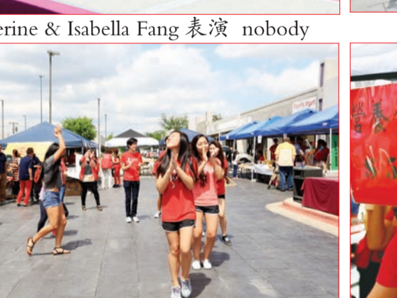
年輕義工們快樂起舞