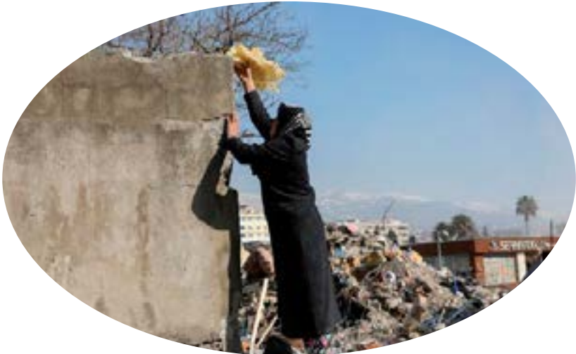
A woman takes bread out of the rubble of her house, in the aftermath of a deadly earthquake in Kahramanmaraş, Turkey.