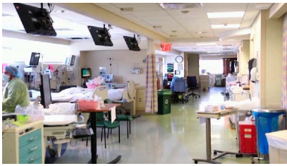
Once the emergency expires, people with private insurance will have some out-of-pocket costs for vaccines, tests and treatment, while the uninsured will have to pay for those expenses in their entirety.

Congress has already blunted the reach of the public health emergency that had the most direct impact on Americans, as political calls to end the declaration intensified. Lawmakers have refused for months to fulfill the Biden administration's request for billions more dollars to extend free COVID vaccines and testing. And the $1.7 trillion spending package passed last year and signed into law by Biden put an end to a rule that barred states from kicking people off Medicaid, a move that is expected to see millions of people lose their coverage after April 1. The costs of COVID-19 vaccines are also expected to skyrocket once the government stops buying them, with Pfizer saying it will charge as much as $130 per dose. Only 15% of Americans have received the recommended, updated booster that has been offered since last fall.