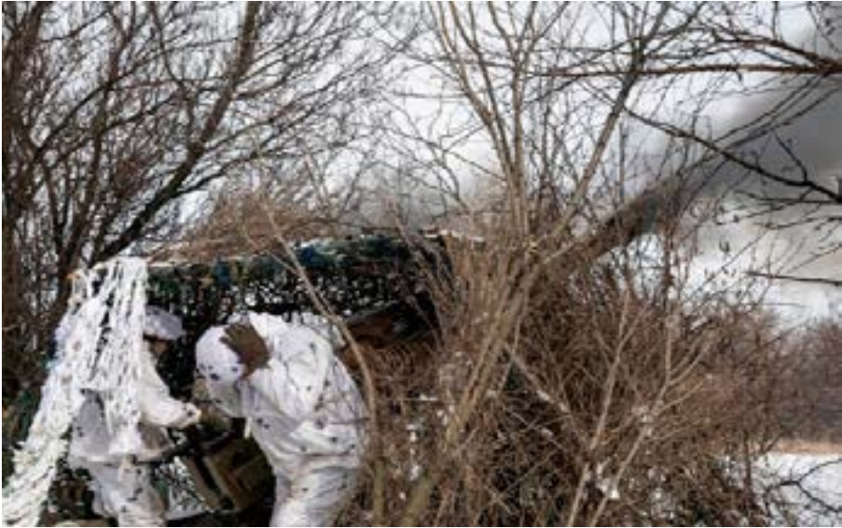
Ukrainian servicemen of the 80th Air Assault Brigade fire an M119 Howitzer artillery weapon towards Russian troops, amid Russia's attack on Ukraine, near Bahmut, Donetsk region, Ukraine.