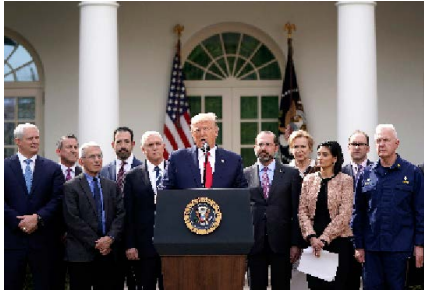
Former President Donald Trump Declared The COVID-19 Pandemic A National Emergency On March 13, 2020.

It comes as lawmakers have already ended elements of the emergencies that kept millions of Americans insured during the pandemic. Combined with the drawdown of most federal COVID-19 relief money, it would also shift the development of vaccines and treatments away from the direct management of the federal government.