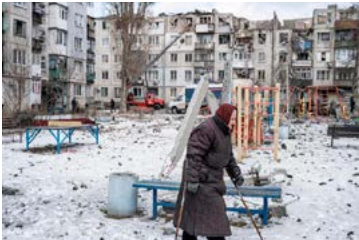
A woman walks on a playground after an apartment block was heavily damaged by a missile strike, amid Russia's attack on Ukraine, in Pokrovsk, Donetsk region, Ukraine.