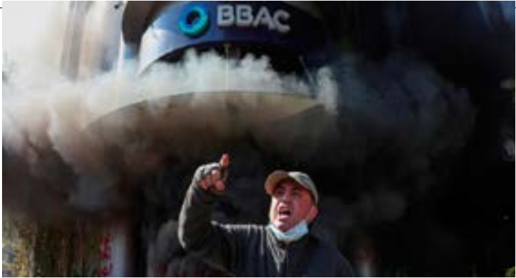
A demonstrator gestures near a bank, set on fire, during a protest organized by Depositors' Outcry, a group campaigning for angry depositors, against informal restrictions on cash withdrawals and deteriorating economic conditions in Beirut, Lebanon.