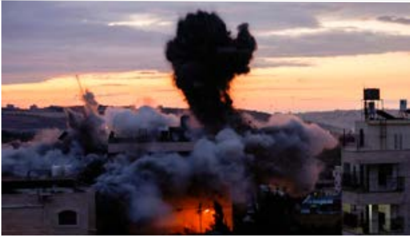
An explosion is seen as the Israeli army demolishes the house of a Palestinian man who carried out a shooting attack in the Jewish settlement of Kiryat Arba, in Hebron, in the Israeli-occupied West Bank.