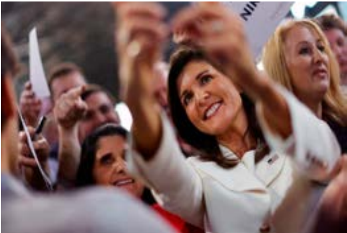
Former U.S. Ambassador to the United Nations Nikki Haley takes pictures with her supporters as she announces her run for the 2024 Republican presidential nomination at a campaign event in Charleston, South Carolina.