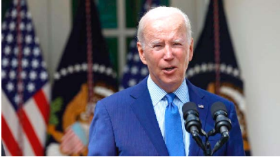
President Biden Will End COVID Emergencies On May 11th, 2023.

A senior administration official said the three months until the expiration would mark a transition period where the administration will "begin the process of a smooth operational wind-down of the flexibilities enabled by the COVID-19 emergency declarations." The official spoke on the condition of anonymity to discuss the announcement before it had been released. More than 1.1 million people in the U.S. have died from COVID-19 since 2020, according to the Centers for Disease Control and Prevention, including about 3,700 last week. Case counts have trended downward after a slight bump over the winter holidays, and are significantly below levels seen over the last two winters — though the number of tests performed for the virus and reported to public health officials has sharply decreased. Moments before the White House's announcement, Rep. Tom Cole, R-Okla., accused the president of unnecessarily extending the public health emergency to take action on issues like forgiving some federal student loan debts.