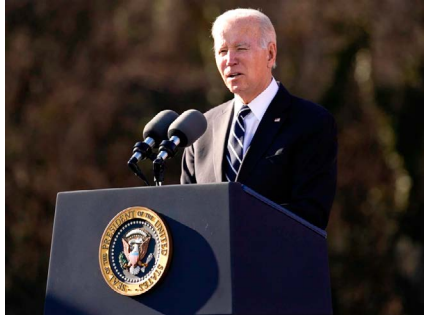
President Joe Biden