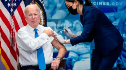
President Biden Received His Covid Vaccine During the Emergencies.

Former President Donald Trump first declared the COVID-19 pandemic a national emergency on March 13, 2020. The emergencies have been repeatedly extended by Biden since he took office in January 2021, and are set to expire in the coming months. The White House said Biden plans to extend them both briefly to end on May 11. "An abrupt end to the emergency declarations would create wide-ranging chaos and uncertainty throughout the health care system — for states, for hospitals and doctors' offices, and, most importantly, for tens of millions of Americans," the Office of Management and Budget wrote in a Statement of Administration Policy.