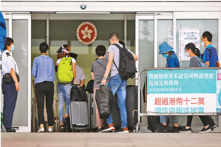
廣州將加強落實香港入境人員核檢及口岸檢疫等管理。圖為本月初廣東收緊由香港入境廣東防控措施首日,香港市民從深圳灣口岸排隊等待離港入境。 資料圖片

管理;加強跨境貨車司機口岸點、作業點、居住點、運輸沿線等“三點一線”閉環管理,做好深港往來小型船舶船員和流動漁民等重點人群的疫情防控,推進電子化通關、健康碼轉換和互認等措施。