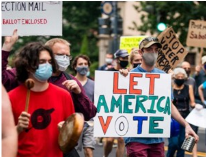
數百萬人抗議川普散佈關於郵政投票的錯誤資訊和郵局的政策變化，這可能會延遲11月選舉之前的郵政選票交付時間

（休士頓/秦鴻鈞報導）由於冠狀病毒的襲擊，許多人不願為總統大選出去投票。川普總統已經公開表示強烈反對郵寄投票的建議。最近幾個月，共和黨與民主黨之間對郵寄投票的辯論和爭吵變得越來越嚴重。根據常識，很容易理解郵寄選票的好處。首先，選票寄到家門口，再免費寄出選票，而且沒有被冠狀病毒感染的危險。科羅拉多州從2013年左右開始郵寄投票，一年內投票率猛漲了10%。儘管有這些好處，為什麼川普反而不開心呢？這是因為多出來投票的這些人，很可能不投他。美國大選的“潛在選民”通常都有一些特徵，像是有色人種偏多，經濟和教育水平都偏低，這群人通常比較傾向民主黨。