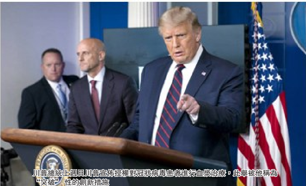
川普總統上週日川普宣佈授權對冠狀病毒患者進行血漿治療，此舉被他稱為“突破”性的創新措施

到目前為止，全美疫情繼續蔓延，佛羅里達州，加利福尼亞州和德州新冠確診病例都超過60萬。冠狀病毒患者期望這種新的治療方法在不久的將來能夠真正幫助他們。