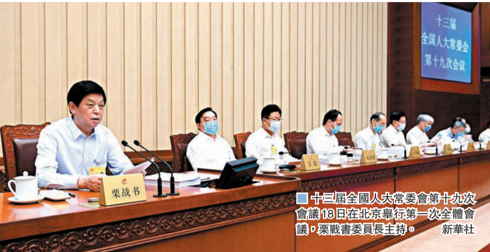
十三屆全國人大常委會第十九次會議18日在北京舉行第一次全體會議，栗戰書委員長主持。