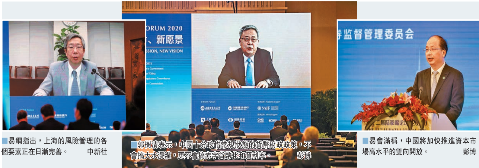
■易綱指出，上海的風險管理的各個要素正在日漸完善。