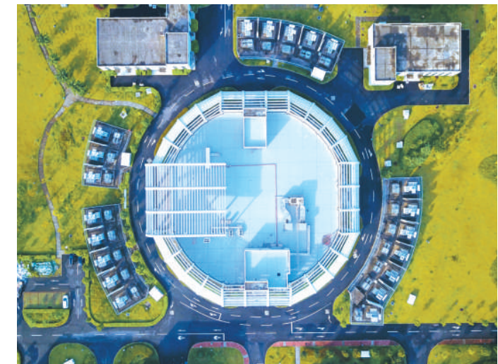
位于广东省东莞市大朗镇的中国散裂中子源。

“5G网络建设不仅涉及大量的工程、基站、供电等基建投资，还将激发各行业转型升级，引导工厂改造、建设运营、系统升级、技术培训等诸多投资。预计到2025年，5G网络建设投资累计将达到1.2万亿元，累计带动相关投资超过3.5万亿元。”王志勤说。