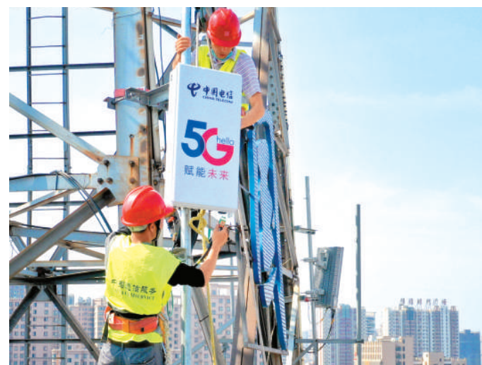
5月4日，在安徽省六安市区，中国电信六安分公司工人正在进行5G基站设备安装、调试。