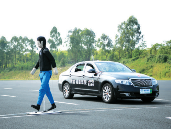
4月7日，在重庆高新区的国家质检基地，技术人员在机动车强检试验场内进行自动驾驶功能测试评价。