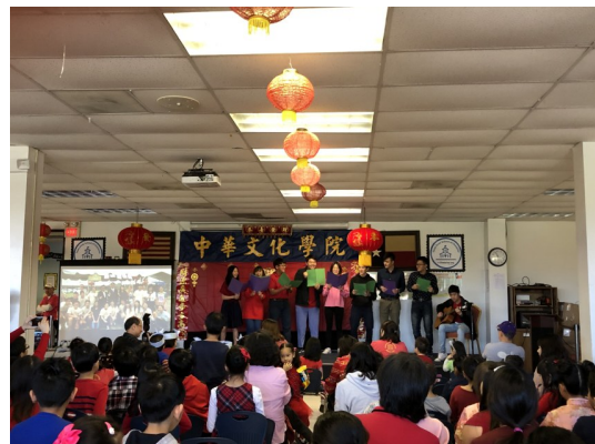
畢業班的大合唱，排場浩大！