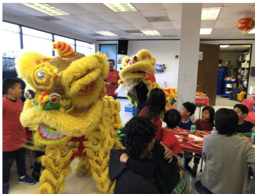
祥獅獻瑞，鼓舞人心！