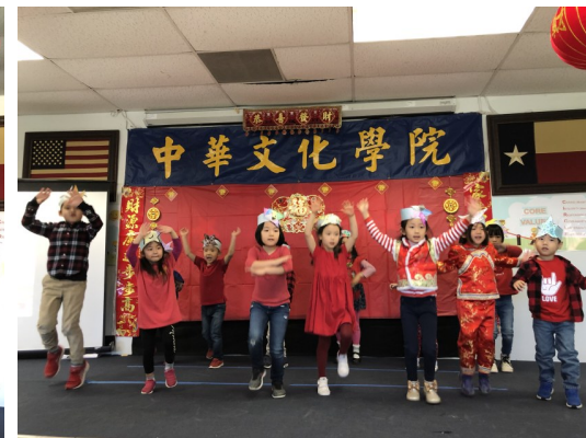
小星星，亮晶晶，真可愛！