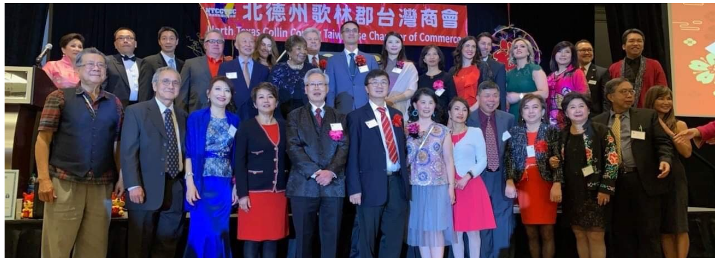
晚會接近尾聲，賓客(中排左六 Eddie Bernice Johnson)同唱「高山青」同樂。