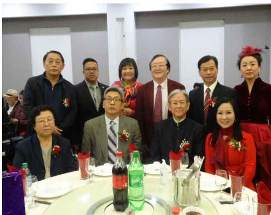
出席大會的貴賓、社團代表至主桌與中國駐休斯敦總領事蔡偉(前排左二)合影。