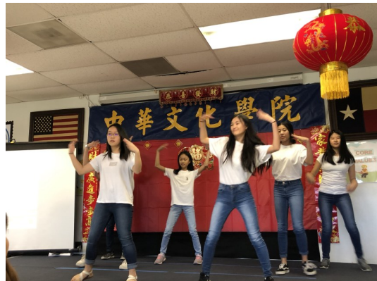
中八班的熱歌勁舞，令人讚嘆！