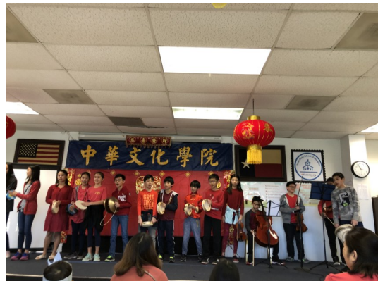
中班的樂器演奏，琴瑟和鳴！