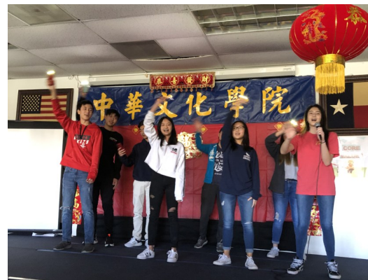
中九班的動態閃亮演唱，特有創意！