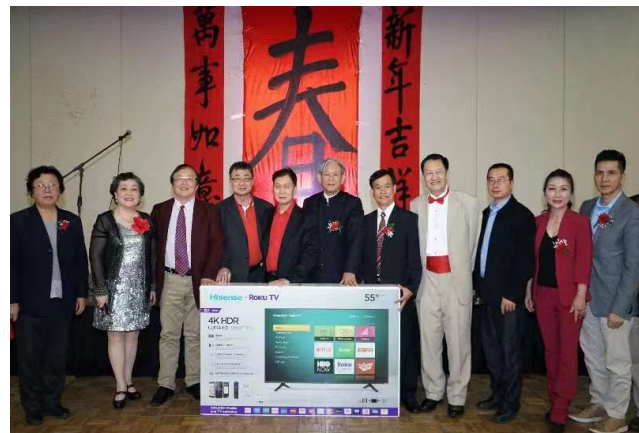
所有出席大會的貴賓、各社團代表合影於大獎前。