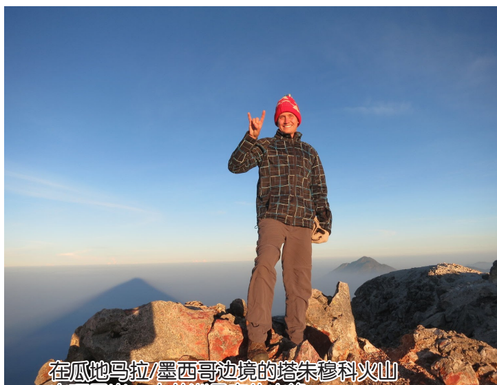
在瓜地马拉/墨西哥边境的塔朱穆科火山山顶日出—中美洲最高的山峰

【本报讯】有时，大学录取看起来就像爬山一样。至少在一座山上，你知道到达山顶需要什么。大学录取？这个过程极其复杂，即使你包装了所有正确的齿轮，并考虑所有必要的准备，你可能无法到达顶部。