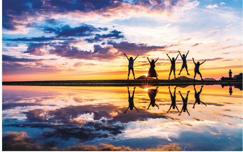
以往任何时候都更加强劲。 (文章来源:美房吧, meifang8kefu)

为了支持和鼓励这一新兴的大市场参与者，这个行业必须继续发展，并把发展的重点放在年轻人身上。就目前而言，未来看起来比