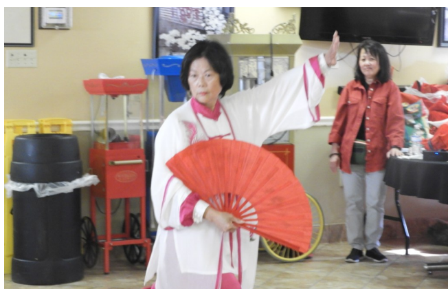
世界廣東同鄉會休士頓分會感恩送暖活動示範太極保健功法