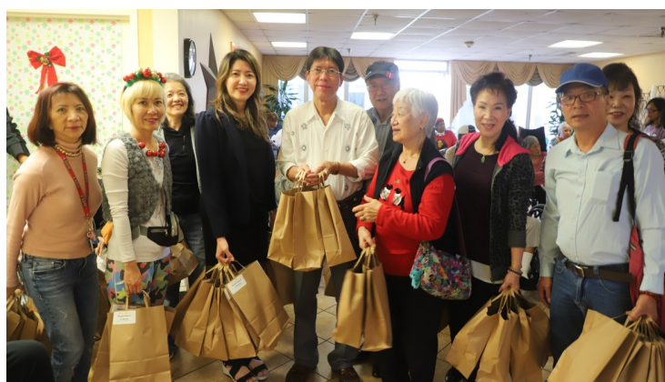
世界廣東同鄉會休士頓分會會員及眷屬攜帶慰問品送到每間寢室感恩送暖