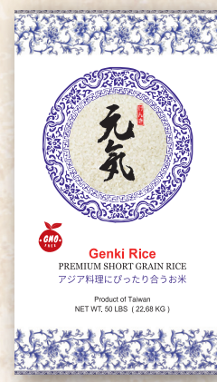
Genki Rice 50 LBS