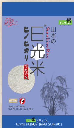
Sunshine Rice 50 LBS