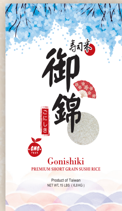
Gonishiki Rice 15 LBS