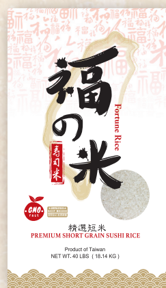
Fortune Rice 40 LBS