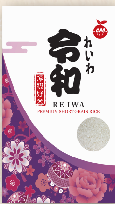
Reiwa Rice 50 LBS