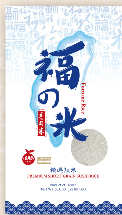
Fortune Rice 50 LBS