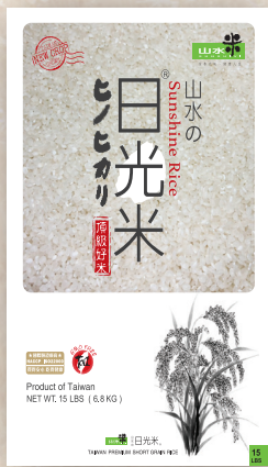
Sunshine Rice 15 LBS