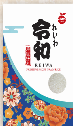
Reiwa Rice 15 LBS