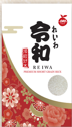
Reiwa Rice 40 LBS