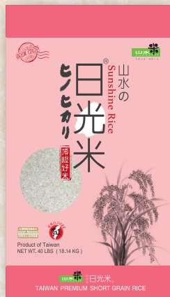
Sunshine Rice 40 LBS