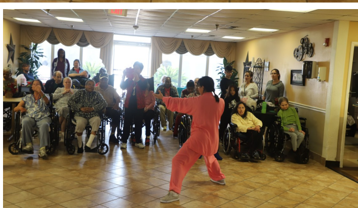
世界廣東同鄉會休士頓分會邀請太極高手示範自我保健起手式