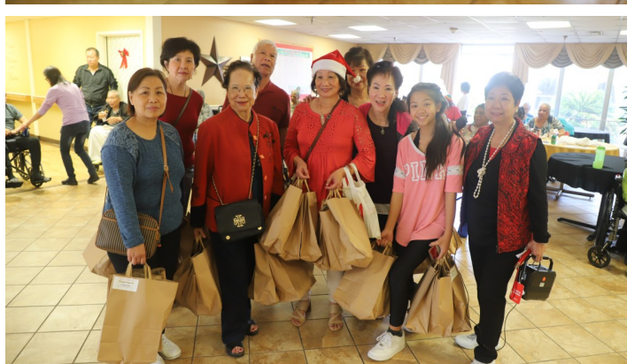
世界廣東同鄉會休士頓分會會員及眷屬攜帶慰問品送到每間寢室感恩送暖