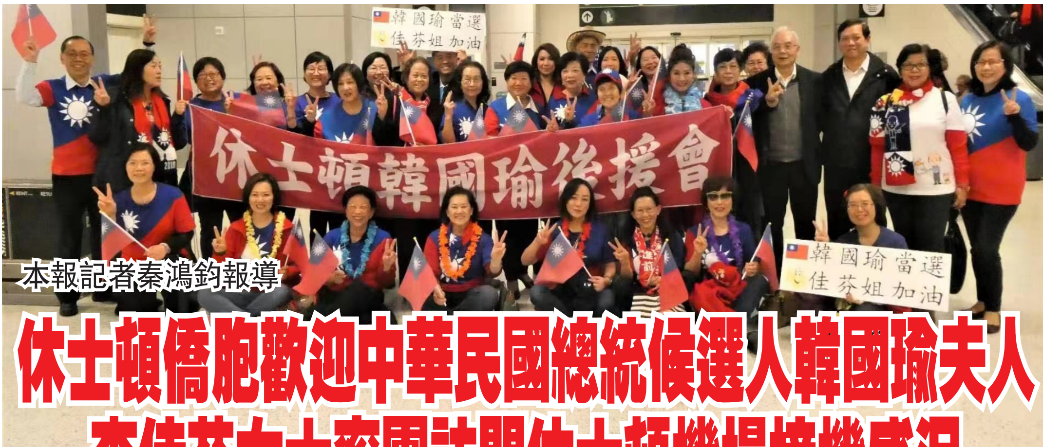
本報記者秦鴻鈞報導