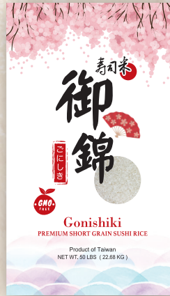
Gonishiki Rice 50 LBS