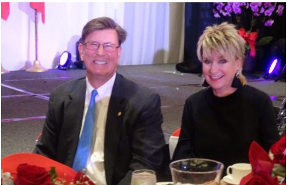
德州糖城市市長Joe Zimmerman夫婦,在現場見到好朋友們,笑得好開心。