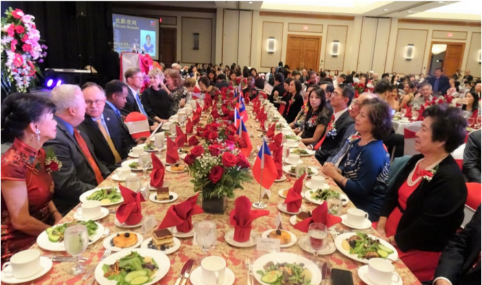
中華民國108年雙十國慶晚宴,上周日晚舉行,政要嘉賓雲集,六百人出席盛宴。