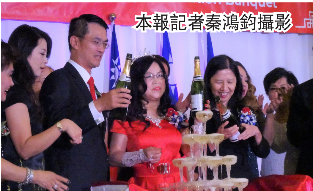
本報記者秦鴻鈞攝影