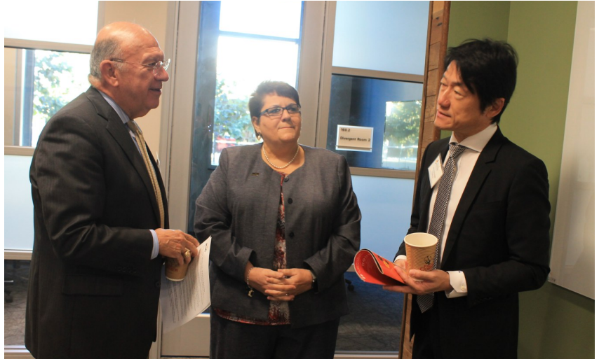
HCC 總校長 Cesar Maldonado 博士(左)、西南校區校長 Madeline Burillo-Hopkins 博士(中)、與日本駐休斯頓總領事福島秀夫(右)合影。

在提供課程、員工培訓和終身學習機會，HCC 素來享有口碑。有關更多信息，請致電 713.718.2000 或 713.718.2277，或訪問 hccs.edu 。