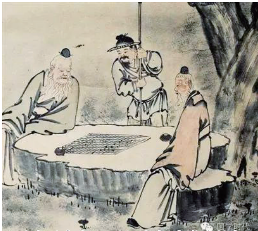
局上閒爭戰，人間任是非。空教采樵客，柯爛不知歸。