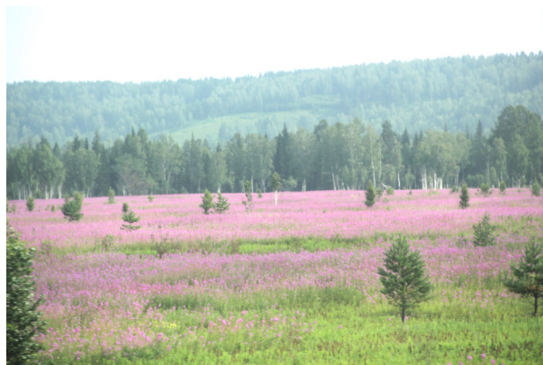
鐵路兩旁盡是白樺、松林及粉紅色的 Ivan Tea 花

克拉斯若亞爾斯克 (Krasnoyarsk) 是葉尼塞河畔的大城，水路與陸路交通重鎮，人口有一百多萬。我們在火車上見到浩浩蕩蕩的葉尼塞河。新西伯利亞城 (Novosibirsk) 位於鄂畢河畔，是建西伯利亞大鐵道新興的城市，後於 1918–1922 俄國內戰中被嚴重破壞。史達林時期成為工業重鎮，現為西西伯利亞首府，人口一百五十萬。這一途中猶是森林區，經過一段沼澤區及斷續的草地，油菜花黃遍野；還有許多白色、紫色野花，及粉紅花 (Ivan Tea)。這些春夏野花點綴森林，顯得生意盎然。這一帶屬於中亞大陸性氣候，冬寒夏炎；據報導冬天溫度會低到攝氏負 40 度，但夏天可熱到攝氏正 40 度。