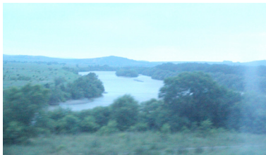
烏蘇里江沿岸人煙稀少