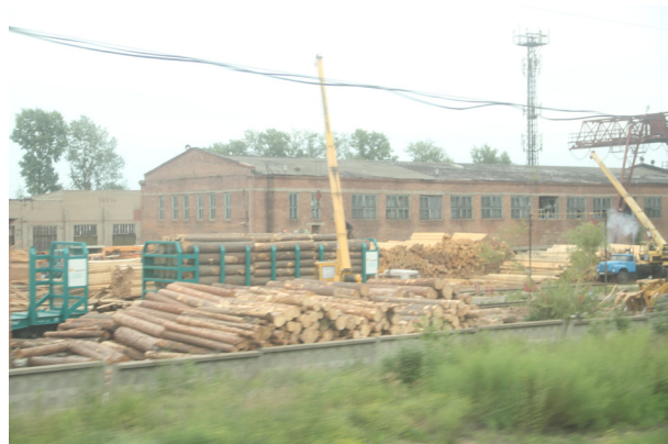
這九千多公里的車程都是在森林區內，沿途見到許多木材廠及運送木材的火車

我們最後的一程是由葉卡捷琳堡去莫斯科，這一段已出了西伯利亞，也出了亞洲，但沿途猶是白樺、松林。這九千多公里的車程都是在森林區內，沿途見到許多木材廠及運送木材的火車，俄國的木材可謂取之不盡、用之不竭。西伯利亞，特別是葉卡捷琳堡附近的秋明油區盛產石油，我們一路見到許多輸油的火車。其他運各種貨物的貨車也非常多，可見西伯利亞大鐵道運輸量巨大，