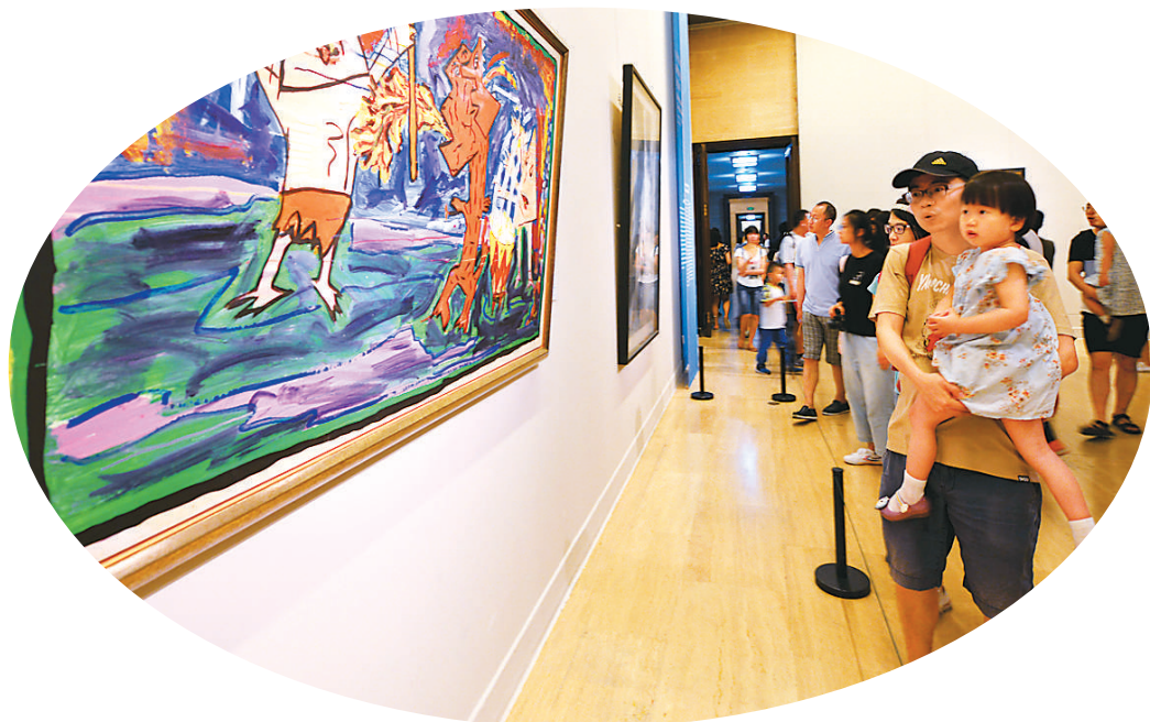
观众在中国美术馆参观“美美与共——中国美术馆藏国际艺术作品展”。

现在有一些游客,去到一个地方旅游,会先选择游览当地的博物馆,以此作为一种打开这个城市的方式。欣赏艺术展览,或许是拥抱陌生城市的好办法。电视节目《国家宝藏》播出后,其中涉及的多家地方博物馆的游客接待量明显提升。在线旅游网站显示,通过“博物馆”搜索国内旅游产品的游客上升了50%,博物馆迎来了游客参观的高潮。无论是走马观花的普通观众,还是细细品味的专业观众,看展览的旅游休闲方式受到越来越多的欢迎。