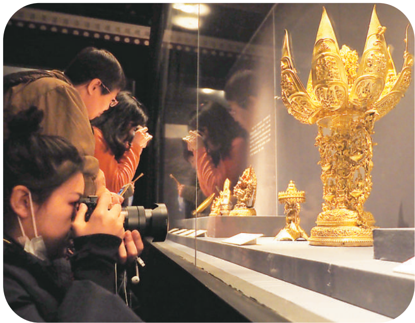
观众在首都博物馆《天路文华——西藏历史文化展》。

近年来,很多人选择去博物馆、美术馆参观展览度假休闲。观展不再是少数专业人士的文化需求,它更多的是面向普通人的一种休闲方式。文化艺术在社会生活中的渗透渐深,已成为很多市民和游客的消费习惯。在采访中,记者了解到,很多逛博物馆、美术馆的年轻人,不仅仅是去学习知识,他们更喜欢的是在这样的艺术空间里,看展览、听讲座、读书,