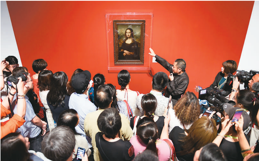
杭州日前举办欧洲文艺复兴时期艺术珍品展,策展人在达·芬奇的学生贝纳尔迪尼·鲁易尼临摹的布面油画《蒙娜丽莎》前向游客讲解。

前不久,我来到陕西历史博物馆,望不到头的排队长龙和故宫博物院参观潮一样壮观。正在展出的陕西国宝系列特展、唐墓壁画珍品馆、大唐遗宝——何家村窖藏出土文物展吸引着大批观众。我顶着烈日,排了两个小时的队才进馆。来自山西太原的初中生林同学,喜欢读历史,这次利用周末时间,和妈妈坐高铁专程来陕历博看文物展。西安人告诉我,现在陕历博和兵马俑、大雁塔一样,是最受游客青睐的景点,西安研学之旅都把陕历博列入其中。