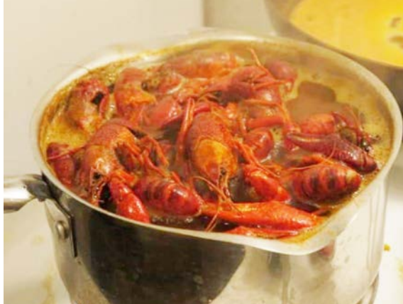
自己料理小龍蝦也非常簡單。

另外，Bayou city seafood鄰近Galleria區域，以大量加上合理的價錢出名，除了一磅7.99元的小龍蝦可品嚐，店內也有許多南方風味十足的海鮮料理和拼盤，也是吃蝦熱點。 近中國城，位於Wilcrest路上的Wild Cajun也頗受當地人歡迎，店內銷售人氣王小龍蝦拼盤一磅價格比去年漲價一塊8.99元，還是吸引慕名而來。若是光吃小龍蝦無法滿足，也可以來個混搭，小龍蝦與鮮蝦拼盤一磅8.99元，同樣是搶手貨。