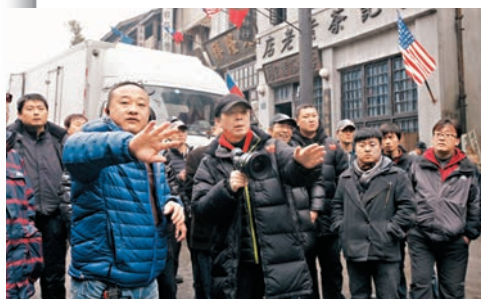
■馮小剛自言在攝製組有時候會「破口大罵」。

「舉例來講，在我們的攝製組，幾乎所有的化妝、服裝、道具、製景、照明都是農民工，不具備基本的專業技能，比如做照明的經常是一個村裡的，什麼都沒見過，到攝製組來「掃盲」。」馮小剛坦言，自己在攝製組有時候會「破口大罵」，因為經常會出現一些常識性的問題，拍的電