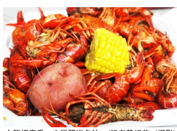
小龍蝦產季，肉質肥嫩多汁。

(記者黃相慈／休士頓報導)每年3至5月是「小龍蝦」(crawfish)的產季，烹煮過紅通通的小龍蝦一上桌，魅力無法擋，總是成功抓住饕客的胃。趁著小龍蝦盛產，休士頓各大餐館海鮮餐館推出產季熱賣，招攬客人，也成功吸引大排長龍上癮。 走訪休士頓海鮮與小龍蝦餐館，在小龍蝦產季鳴笛起跑之際，幾乎每家店一到用餐時刻都是高朋滿座。 小龍蝦連鎖知名品牌LA Crawfish是許多愛蝦客最常光顧的餐館，LA Crawfish走低價路線，在休士頓有許多分店，產季時是一位難求。余燙調味的小龍蝦一磅才6.99元，蒜味奶油(Garlic Butter)和Cajun Style和酸辣醬汁(Hot&Sour)稍微調味就讓小龍蝦味道豐富美味，鮮味四溢。