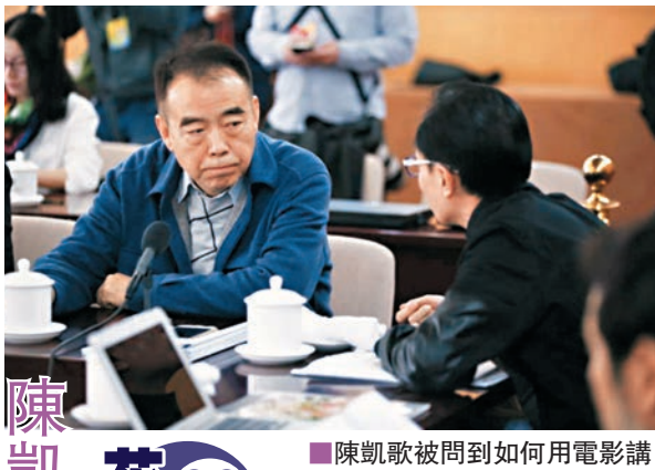
■陳凱歌被問到如何用電影講好中國故事。

基於此，明年，馮小剛所說的影視技工學校將正式成立。他說，每年即使輸出1萬名受過訓練的影視基礎工作人員，連續十幾年也能對電影隊伍整體素質的提高有所幫助。「我們會參考「藍翔技校」的模式，學習時間不會很長，1年多最多2年的時間內，教給他們基本的影視知識，然後再輸出到攝製組。」馮小剛說，目前最大的難題在於化妝、服裝、道具、照明、製景的師資短缺，「中國做得最好的也達不到授課水平」，因此，他們將大量投入，從好萊塢請大批的老師來，為提升中國電影的基礎工作人員素質盡一分力。