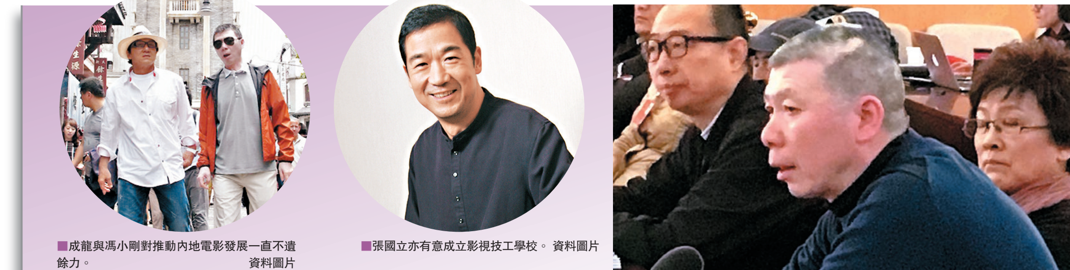
■成龍與馮小剛對推動內地電影發展一直不遺餘力。資料圖片 ■張國立亦有意成立影視技工學校。資料圖片