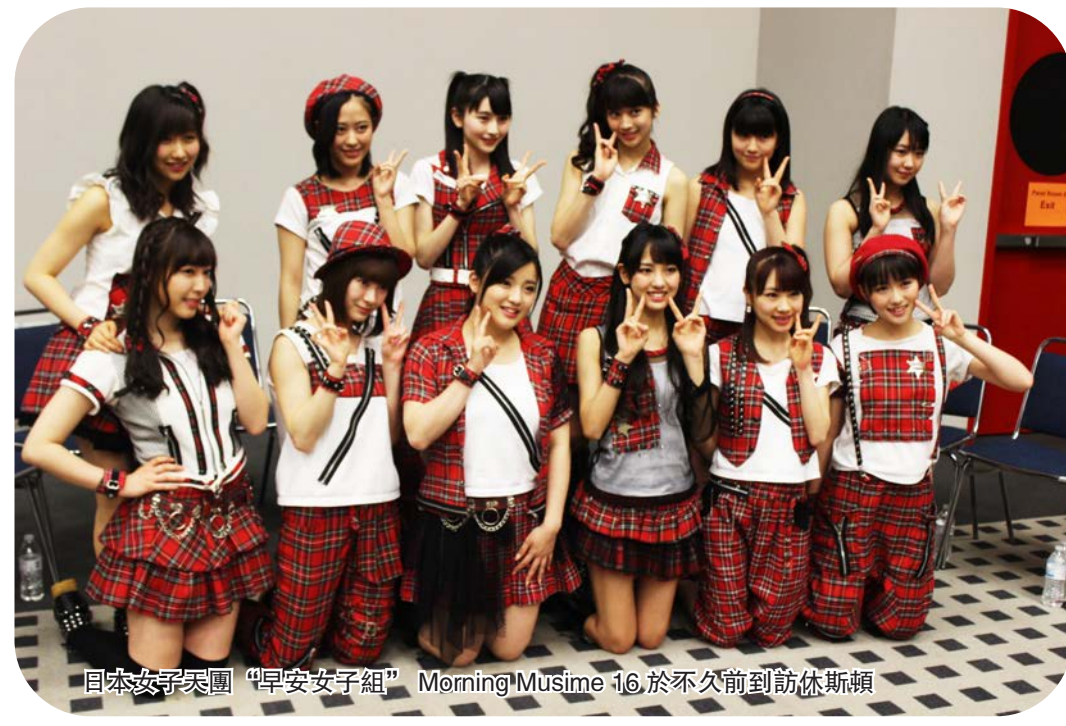
日本女子天團「早安女子組」Morning Musime 16 於不久前到訪休斯頓