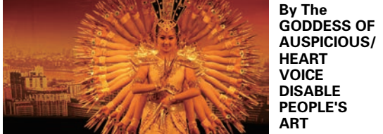
TROUPE. The dancers use different sensing method to meet the beats of the music and the instruction of sign language from the edge of the stage to coordinate their motion and movement to accomplish the complicated dance program with rhythmic strength.