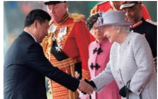
Britain's Queen Elizabeth II (R) shakes hands with China's President Xi Jinping (L) at the royal pavilion on Horse Guards Parade in central London on October 20, 2015.