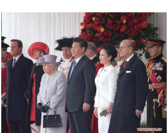
Visiting Chinese President Xi Jinping (2nd L, front), his wife Peng Liyuan (2nd R, front), British Queen Elizabeth II (1st L, front), and Prince Philip (1st R, front) attend a traditional ceremonial welcome in London, capital of Britain, Oct. 20, 2015.