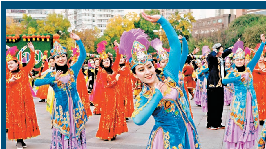
逾萬名維族、漢族、哈薩克族、回族、蒙古族等身著盛裝的各族民眾，一同跳舞慶祝。