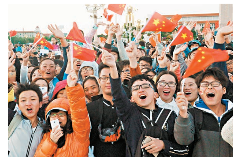
來自全國各地的民眾在天安門廣場觀看升旗儀式後，揮舞著國旗，始終不願離去。

香港文匯報訊（記者 田一涵 北京報道）10月1日是新中國66周年國慶日，來自全國各地的超過5萬名民眾在北京天安門廣場觀看隆重的升旗儀式。當天天安門遊客數量激增，記者實地採訪發現，通過不足30米的安檢通道，需要近半個小時。以往人滿為患的故宮進行了每日8萬人的限客政策，未出現往年的“癡癡”現象。