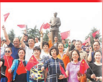
10月1日是中華人民共和國成立66周年，眾多遊客手持國旗到湖南韶山毛澤東銅像廣場慶祝國慶。

10月1日上午，在舉國歡慶新中國成立66年之際，北京101中學金帆交響樂團近100位學生在湖南毛澤東故居韶山銅像廣場前，以閃爍的形式，奏響紅歌，緬懷先輩，歡度國慶。據悉，北京101中學是習近平主席等諸多國家領導人的母校，1946年始建於革命老區張家口。