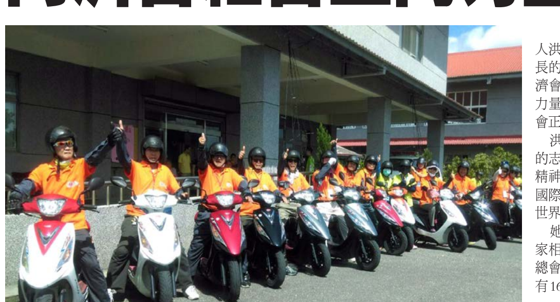
不老騎士追夢不滅 挑戰花東南迴 臥道老人福利基金會「不老騎士」邁向第6屆，今年的追夢車隊分別以摩托車、電動自行車為主，從花蓮市區沿著台9線穿越花東縱谷，挑戰南迴公路，預定4日抵達屏東縣潮州火車站，完成346公里的夢想旅程。