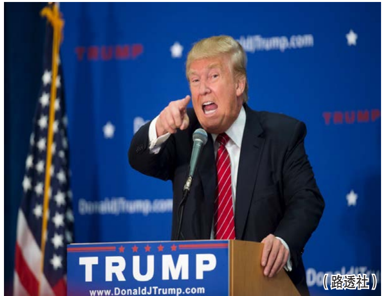
“特朗普回答：‘是的，我就是這麼認為。’當有人詢問萊恩等人有何動機‘造假’時，特朗普表示：‘因為我有名氣，而他們沒有。’”

（綜合報道）美國《福布斯》雜誌9月29日發布400名最富美國人排行榜，微軟公司創始人比爾·蓋茨連續第22個年頭位列榜首。 不過，這份新鮮出爐的榜單遭到美國地產大亨特朗普的強烈不滿。特朗普自認身家超過100億美元，但最新榜單只承認他擁有45億美元，令特朗普深感“沒面子”。 總財富創歷史新高 《福布斯》最新出爐的400名最富美國人排行榜顯示，上榜者的總財富達到2.34萬億美元，超過以往任何時候，比2014年增長500億美元；上榜者的人均財富為58億美元，比去年增長1億美元。 微軟公司創始人蓋茨憑借760億美元淨資產，連續第22年高居榜首，不過這一數額比去年減少50億美元。“股神”沃倫·巴菲特以620億美元位列第二，而這也是他自2001年以來的一貫排名。 在前10名中，亞馬遜公司首席執行官傑夫·貝索斯在過去一年中的“吸金能力”最強，去年新賺得165億美元，從而以470億美元淨資產排名第四。盡管去年卸任甲骨文公司首席執行官一職，拉裡·埃利森仍憑借475億美元淨資產排名第三。 “臉書”社交網站創始人馬克·扎克伯格首次躋身前10名，以403億美元淨資產排名第七。 特朗普被忽視5億 這份富豪榜發布後，立即引起美國地產大亨特朗普的強烈不滿。特朗普在一份訪談中大罵《福布斯》雜誌“無能、墮落”，竟然低估了他的財富價值。 特朗普多次宣稱，他的淨資產超過100億美元。然而，《福布斯》派調查人員蘭德爾·萊恩採訪80個消息源並投入“前所未有的資源”用於摸清特朗普家底後，最終認定特朗普的淨資產為45億美元，在最新榜單中排名第121名。 特朗普對這一排名非常不滿，“我正在競選總統，我的身家高於你們的統計數字。老實說，這讓我沒面子。我擁有100億美元要比擁有40多億美元更有面子”。 “《福布斯》是一份墮落的雜誌，他們根本不知道自己是在說什麼。我只能說這麼多，真是大讓我不尷尬了。”特朗普余怒未息。 福布斯反唇相譏 萊恩對特朗普的斥責反唇相譏，“難道特朗普認為《福布斯》在計算他的財富時，使用了一套不同於其他富豪的計算方法？