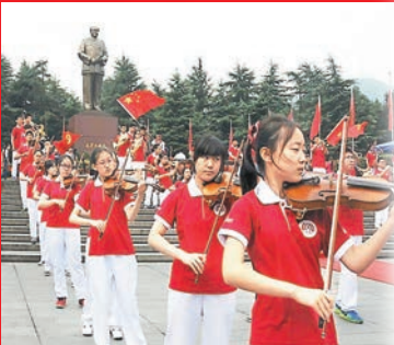
北京101中學金帆交響樂團近百名學生，在湖南韶山毛澤東銅像前演奏。