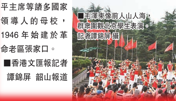
韶山銅像前山人海，數萬觀眾圍觀學生表演。

此次演出的北京101中學金帆交響樂團，全部由該中學在校學生組成，自成立至今已有二十多載。國慶期間，金帆交響樂團還準備參加2015湘江音樂節的演出，本月4日、5日將在美麗的瀟江景觀區湘江玖號，為觀眾帶來一場交響樂視覺與聽覺的盛宴。湘江音樂節為期1個月，到25日才結束，國內外110位藝人參演，將打造成世界時間最長、規模最大、明星陣容最豪華的音樂節。