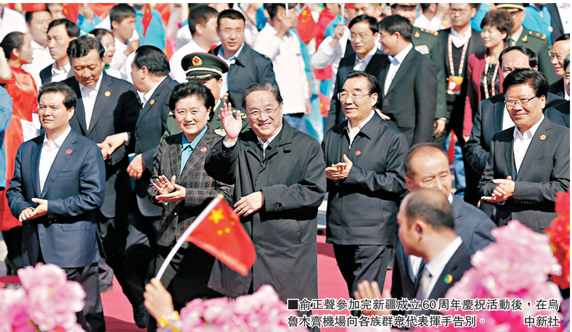
俞正聲參加完新疆成立60周年慶祝活動後，在烏魯木齊機場向各族群眾代表揮手告別。

俞正聲強調，要高舉社會主義法治旗幟，運用法治思維和法治方式維護穩定，建立健全維護工作機制，加強聯防聯控、群防群治，加強意識形態領域反分裂鬥爭，加強“去極端化”工作，推進新疆社會治理體系和治理能力的現代化；要充分認識新疆反分裂鬥爭的長期性、複雜性、尖銳性，保持戰略定力，堅持長期作戰，在開展專項行動、集中打擊的同時，切實加強綜合治理、源頭治理，為實現新疆長治久安和人民幸福安寧提供長效保障。