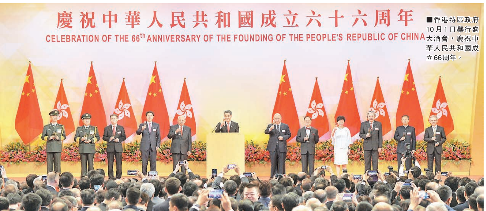
慶祝中華人民共和國成立六十六周年 CELEBRATION OF THE 66 th ANNIVERSARY OF THE FOUNDING OF THE PEOPLE'S REPUBLIC OF CHINA

香港特區政府1日晨舉行66周年國慶升旗儀式，其後，各嘉賓出席了在香港會議展覽中心舉行的國慶酒會。全國政協副主席董建華、特區行政長官梁振英、中聯辦主任張曉明、外交部駐港特派員宋哲、駐港部隊司令員譚本宏及政委岳世鑫、特區終審法院首席法官馬道立、前特首曾蔭權、特區政務司司長林鄭月娥、財政司司長曾俊豐、立法會主席曾鈺成、行政會議非官守議員召集人林煥光等出席。 國慶酒會中，梁振英在致辭時表示，今年是抗戰勝利70周年，上一代在抗戰時期經歷了戰爭的傷害，歷史教訓十分深刻，“我們要銘記落後和挨打的關係。國家是人類社會最大的集體，只有國強民富，我們才有能力維護國土和主權完整、維護國家安全、維護國人尊嚴。” 他續說，改革開放30多年來，國家走出符合自身國情的發展道路，經濟持續高速增長，人民生活不斷改善，國家綜合實力不斷提升，中國在國際事務上的地位和作用越來越受到國際重視。 配合國家戰略 發揮強項 梁振英指出，香港有“一國”和“兩制”的雙重優勢。國家國力提升，香港的優勢更為明顯。以對外關係為例，香港特區根據香港基本法獲中央授權，可以在經濟、貿易、金融、航運等領域單獨與世界各國、各地區及有關國際組織保持和發展關係，簽訂和履行有關協議，也可以參加國際組織和會議，因此香港擁有別於國內外其他城市的外事能力和國際地位。