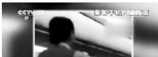
机组乘客均受嘉奖