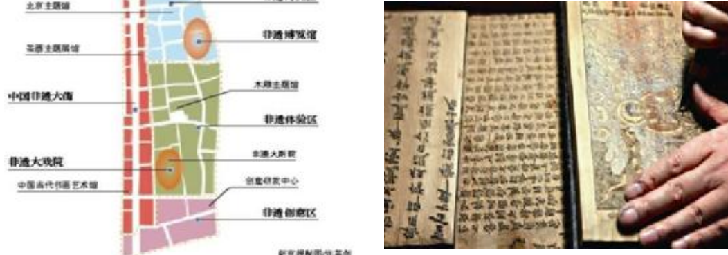
前门大街将“变脸”成中国非遗大街

聚于此，立足非遗保护传承和发扬，着力打造集文化旅游、演艺、会展于一身的文化产业集群。