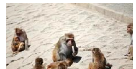
图为猕猴吃冰棍

灵长馆的猩猩猩猩喜欢吃冰棍，阿拉伯狒狒神情原味奶油冰棍，绿狒狒偏爱粉色草莓冰棍。一只叫“老黑”猩猩抢到一只冰棍后，竟捂着嘴笑出声，三步并两步跑到阴凉处慢慢享用起来。