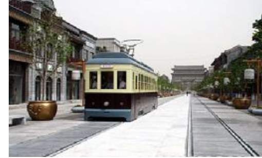
前门大街素有“天街”之称 为中轴线重要坐标 北京前门大街素有“天街”之称，它是北京城中

“保持现有的明清建筑风格。”前门非遗展示园相关负责人介绍，整个园区会保留中式建筑的风格，进行统一管理运营，目前预计会有两百至三百个项目，3000 余非遗大师“扎堆”展示各自技艺，并通过展览展示为大师提供交易平台。