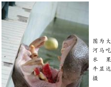
图为大河马吃水果

哈尔滨进入“冰城不冰大烤不停”的暑期。北方森林动物园采取多种方式，为动物降温消暑，动物们则用肢体、声音等特殊语言表在凉爽中的喜悦，一时出现“黑熊熊瑜伽”、“猩猩嘴嗨笑”等有趣景象。