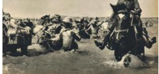
1940 年 5 月 8 日，参加冬宜会战的日军渡过白河

至此，中国在纷乱的国际局势中，没有踏错步伐，顺利成为“世界反法西斯同盟”的核心成员。