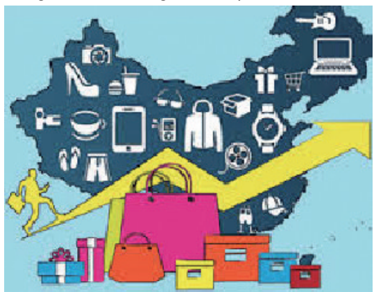
China's Retail Sales Increased