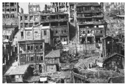
日军轰炸后的重庆

日军对重庆的大轰炸，不仅没能达到其预定目标——“靠轰炸粉碎重庆政权的抗战意志，不那么容易。”⑨反而适得其反，日军对重庆的无差别轰炸，一方面引起英美美各国对中国抗战的关注与同情；另一方面，加剧了日本与英美之间的矛盾，有利于中国争取援助。重庆军民凭借顽强意志，没有屈服于日军的狂轰滥炸，向世界展现了中国的抗战决心，迎来了最后的胜利。