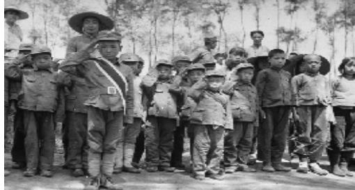
1940 年，河北，八路军根据地的儿童团员们被组织起来，欢迎来访的美国军事观察员

大约同期，中苏关系也已趋冷，“在 1940 年的大部分时间里，苏联对中国的援助救很少或者没有。”同时，苏联还在积极与中国进行接触，“1940 年 7 月，当莫洛托夫在与日本驻苏大使讨论双方缔结中立条约之可能性时，就苏联援华问题表示，由于苏联忙于本国国防，对华援助是做不足道的。”④