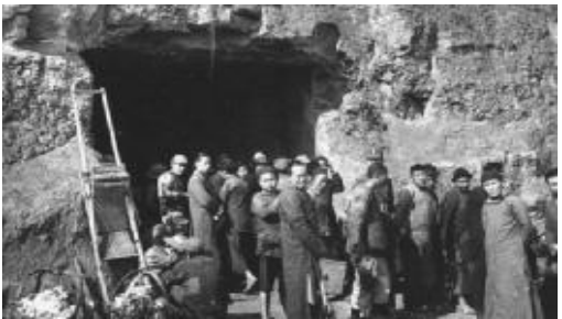
在防空警报暂时解除后，从防空洞出来透风的重庆市民 重庆军民损失惨重，其中民众死伤数万，八路军办事处也遭到轰炸

中国方面的空中防空能力与地面一样薄弱。1939 年，中国空军已损失殆尽，能部署在重庆及其周边的战机只有三四十架。即使加上入驻重庆的一个苏联战斗机联队，实力依旧与日军有很大差距——主要负责对重庆轰炸的日军汉口空军基地，即有各种战机 200 余架。1940 年 6 月 16 日，日军