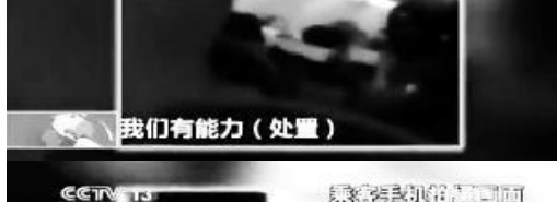
不要着急 坐好 坐好

29 日，民航局对成功处置“7·26”机上纵火事件的深圳航空公司 ZH9648 航班机组进行通报表彰，决定为深圳航空公司 ZH9648 航班机组集体一等功 1 次，奖励 30 万元。同时，决定奖励两名见义勇为乘客各 3 万元。