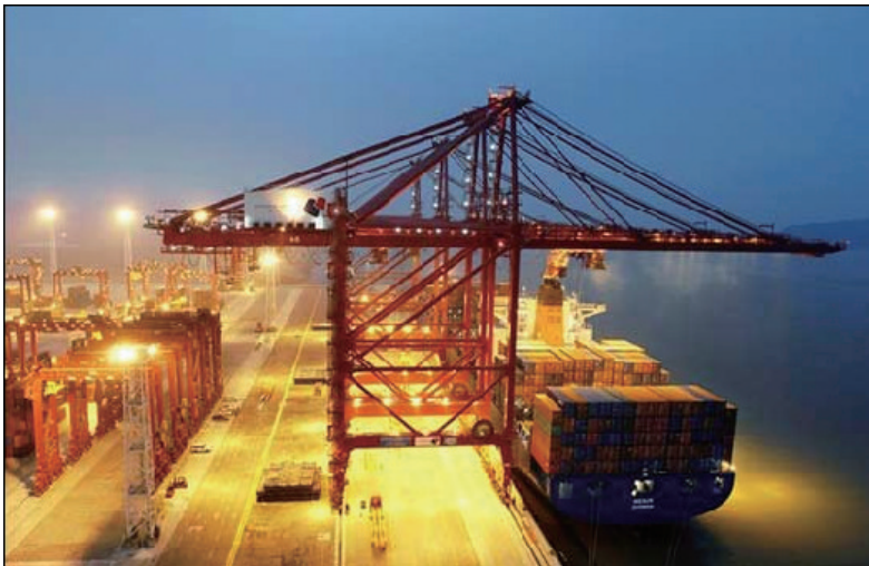
Cranes Load Containers Onto Barges At China Port In Morning Hours

Compiled And Edited By John T. Robbins, News&Review Editor