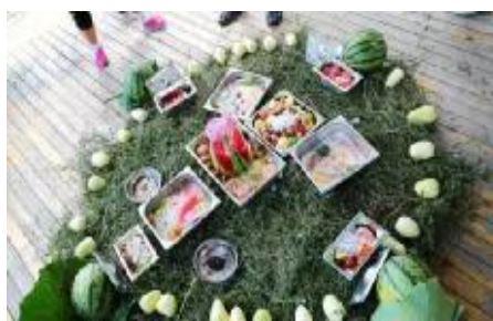
图为北方森林动物园为动物们提供的避暑餐