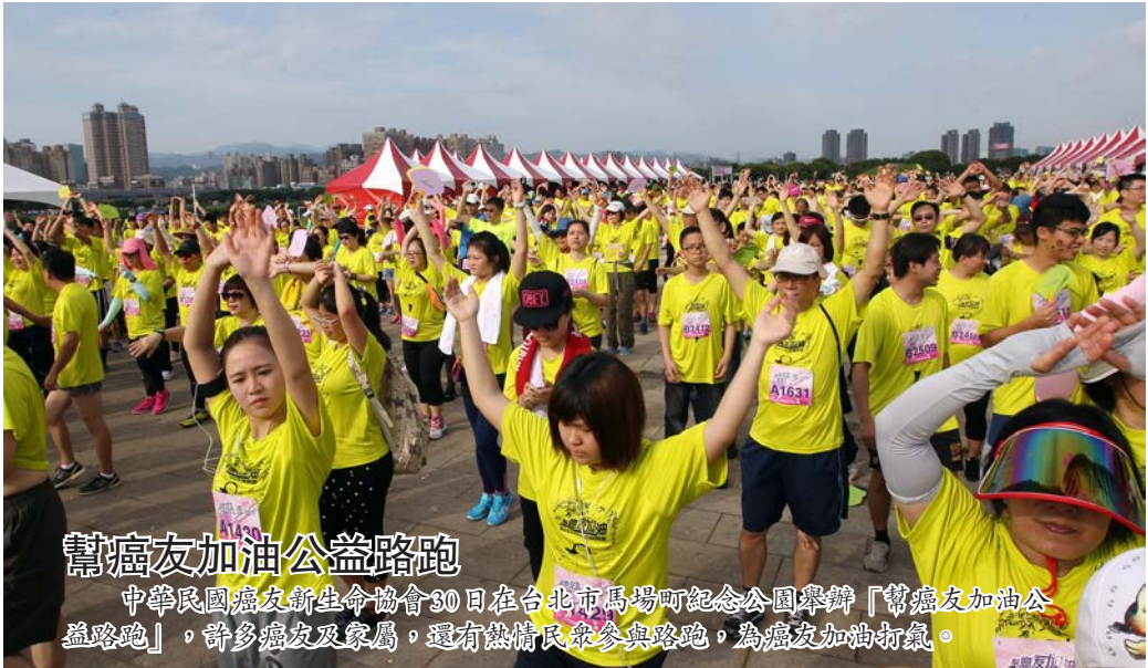
幫癌友加油公益路跑 中華民國癌症新生生命協會30日在台北縣馬場町紀念公園舉辦「幫癌友加油公益路跑」，許多癌友及家屬，還有熱情民衆參與路跑，為癌友加油打氣。

（中央社）淡江戰略所助理教授、新境界智庫國防小組召集人陳文政今天表示，中華民國每天在資訊戰場跟對手交戰，資安能力是台灣的利基，但資訊作戰屬於聯合作戰，資安能力應整合至國軍。 淡江大學國際事務與戰略研究所今天舉辦2015第11屆紀念鉅足鍾戰略國際研討會，由於日前民進黨公布的國防政策藍皮書建議成立第4軍種「網軍」，因此會中對於網軍、網路安全、資訊安全與國防安全有熱烈的討論。 陳文政表示，「網軍」一詞把資訊作戰侷限在網路，低估資訊作戰的本質，這可能是因為民眾對於相關議題的思考就侷限在網路攻防，如果思維沒有改變，有電腦又如何？他說，「國軍不缺電腦，卻沒有資訊化。」 不可以小看臉書的貼文，陳文政表示，因為就是這些文章把國防部打趴，而且有些臉書貼文還查不出來源，那些就是有國家組織的駭客做的。由此可見，整個資訊作戰分別在網路安全、人的認知及實體上打伏。 陳文政指出，從2014年才更新的美軍P3-13準則對資訊作戰下的定義可以看出，美國對於資訊作戰的概念就是聯合作戰，不限縮在單獨個別的軍事能力，資訊作戰應是綜整的戰力，共有戰略溝通、跨部會整合、公共事務、軍文關係、網路作戰等13項戰力，換言之，網路作戰只是資訊作戰的其中一環。 陳文政說，資訊安全與傳統的國防武器裝備不一樣，裝備的壽命極為短暫，一般軍艦可以服役20年，但一支手機不可能使用20年，必須不斷更新。如果資安戰力再被傳統官僚作業限制，將導致剛建軍完成，資安裝備就面臨汰換的處境，他指出，目前國軍的網路戰情系統已是10年前的趨勢。 陳文政表示，過去中國大陸把台灣當作是資訊作戰的練兵場，但如今中國大陸已把練兵場轉移至印度，顯示中華民國在資安戰力上有日趨下滑的趨勢。