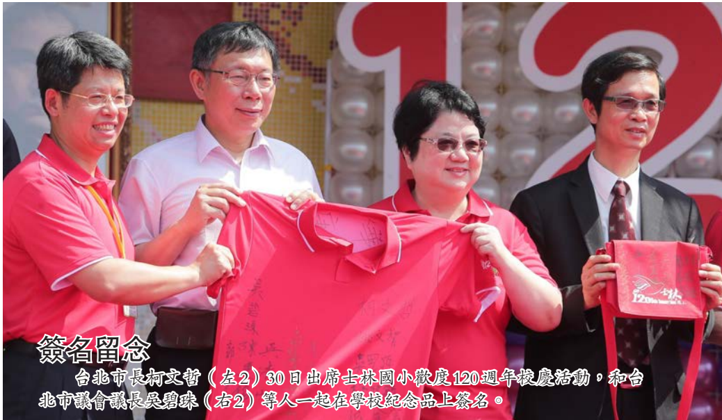
簽名留念 台北市長柯文哲(左2)30日出府士林地檢處小區慶120週年慶活動，和台北市議會議長張盛隆(右2)等人一起在校區紀念上簽名。

（中央社）國民黨將啟動防衛機制民調，副主席郝龍斌今天與立法院副院長洪秀柱溝通，但雙方僅達成原則性問題，包括北中南東各舉行一場政見說明會、6月底前完成民調；但民調方式未獲共識。 表態參選國民黨總統的立法院副院長洪秀柱1人跨越1萬5000份黨員連署後，國民黨中央決定啟動防衛機制民調。擔任提名審核委員會召集人的郝龍斌中午與洪秀柱會面，溝通相關事宜。 郝龍斌說，希望能在6月底前完成民調，絕對不會拖到7月；所以，會比原先先訂完成民調時間的6月13日還要往後延。 至於民調的題目內容，郝龍斌說，草擬好了之後，或由哪幾家民調公司進行，都會再與洪秀柱的代表進行溝通。 不過，對於民調方式，究竟是採取「對比式」或「支持度」？郝龍斌說，洪秀柱表達希望能夠做「支持度」民調，對此，現場則請組發會同仁向洪秀柱簡報說明，未來也會將幾個案子帶回去討論。 郝龍斌說，由於目前時間操之在中央提名審核委員會這邊，所以他們盡快召集開會，最快預計下週二（6月2日）開會研議民調相關細節。 至於有中常委提出徵召方式，郝龍斌表示，一切按照制度走，現在很清楚的，提名審查委員會中，總統候選人只有洪秀柱1位。