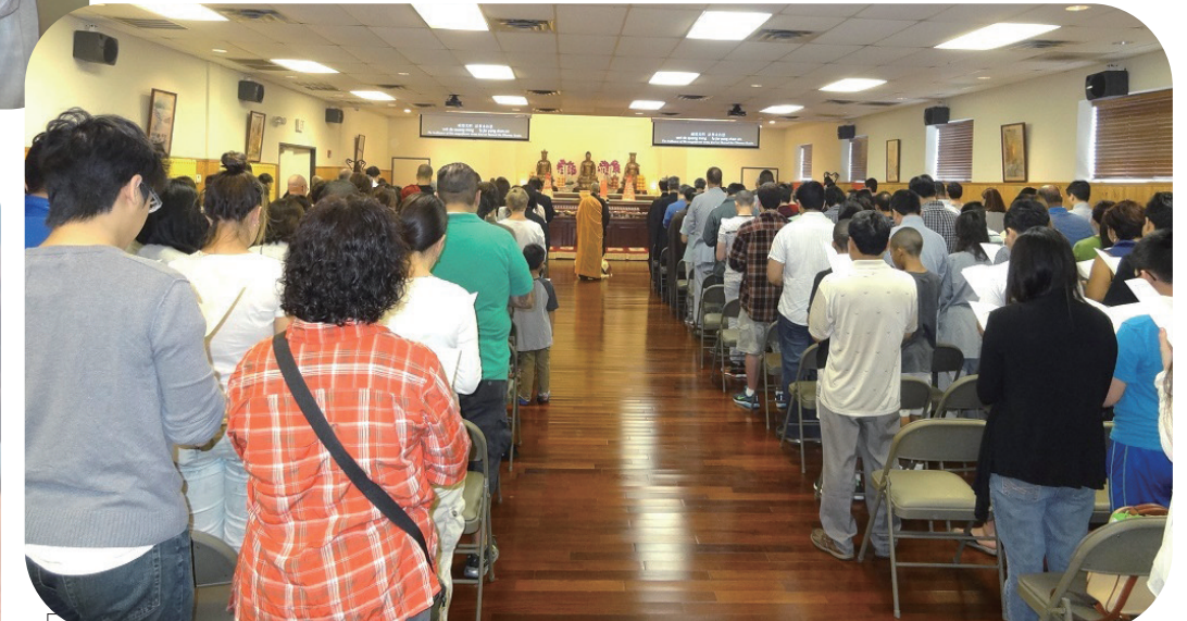
中台禪寺浴佛大典莊嚴肅穆